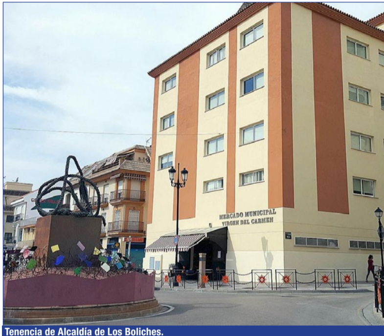
Tenencia de Alcaldía de Los Boliches.

Los interesados pueden apuntarse a través de la aplicación móvil Fuengirola + Empleo, en la página web Fuengirola.portalemp.com o en las propias dependencias de Formación y Creación de Empleo, ubicadas en la cuarta planta de la Tenencia de Alcaldía de Los Boliches.