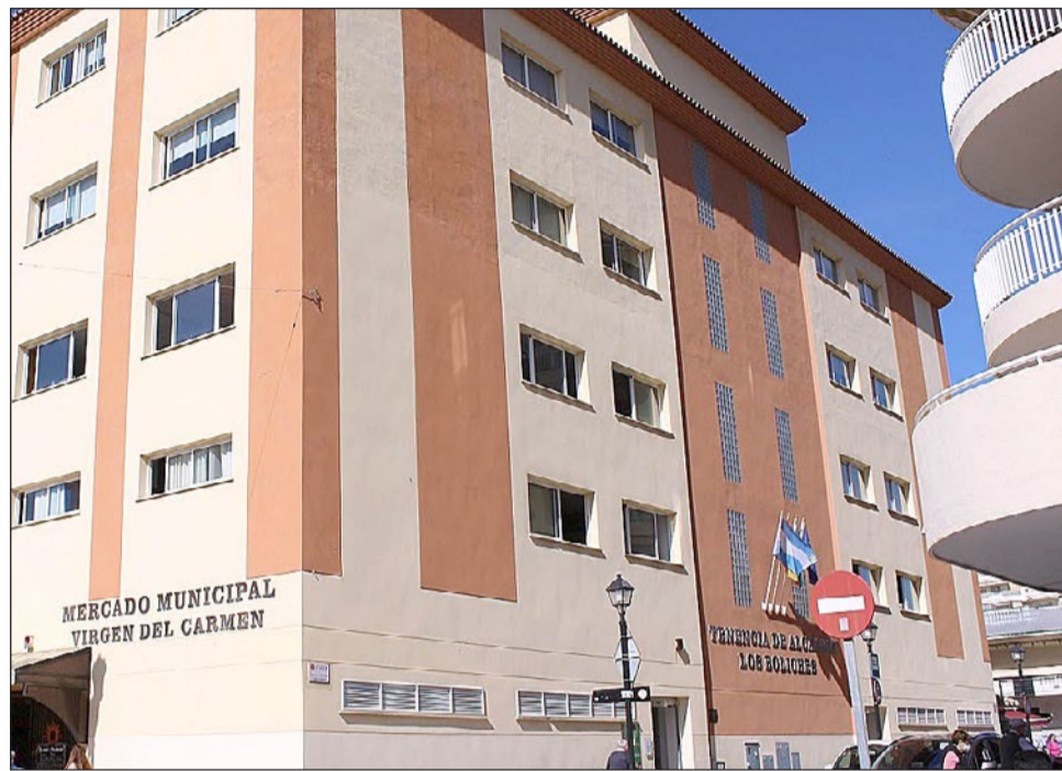
Las dependencias de la Concejalía de Creación de Empleo se ubican en la Tenencia de Alcaldía de Los Boliches.

Para los otros cuatro restantes, Ayudante de cocina y manipulador de alimentos (116 horas), Ayudante de jardinería y productos fitosanitarios (120 horas), Camarero e inglés B1 (300 horas) y Operaciones básicas de limpieza en pisos y alojamientos (75 horas), los requisitos son estar empadronado en Fuengirola y estar en el desempleo. Todo ellos son de modali-