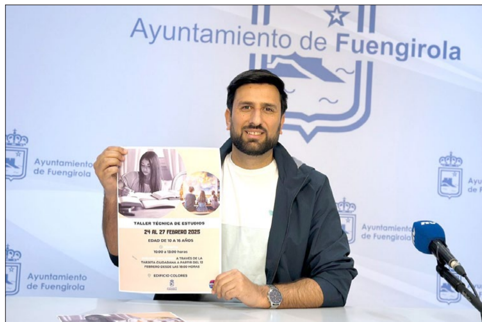
El edil de Juventud fue el encargado de presentar este taller de Técnicas de Estudio.

“Desde la Concejalía de Juventud lanzamos una nueva oportunidad para nuestros jóvenes pensada especialmente para la Semana Blanca. En esta