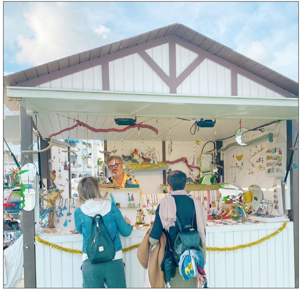
Durante el fin de semana se podrá disfrutar también de Puerto Market.

ro que estará dedicado a actividades saludables: yoga, talleres de alimentación consciente, mandalas, plantación de semillas y creación de huertos (en horario ambos días entre las 12.00 y las 14.00 horas), contando por la