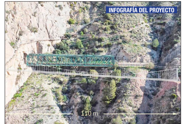
INFOGRAFÍA DEL PROYECTO

no de Andalucía. Posteriormente, a las 12.00 horas, se celebrará en el auditorio Cristóbal Blanca del Moral del parque de España el tradicional concierto de la Banda Municipal de Música. Página 5