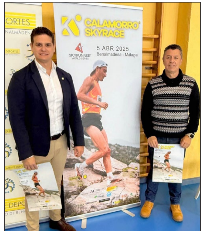
El edil de Deportes durante la presentación de la prueba.

- CxM Calamorro Open / Junior / Juvenil (10,2k/+584 m) con salida a las 18.00 horas (Fem. y Masc.).