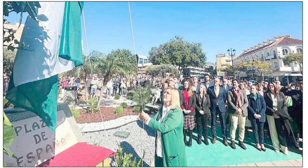
Momento de la celebración del Día de Andalucía en 2024 que tuvo como escenario la Plaza de España.

"El Ayuntamiento de Fuengirola todos los años pone mucho empeño en la celebración de un día muy importante para todos los andaluces como es el 28 de febrero", manifestó Moreno, quien destacó que "este año cae en viernes, coincide con la Semana Blanca, y hemos querido organizarlo en el barrio de Los