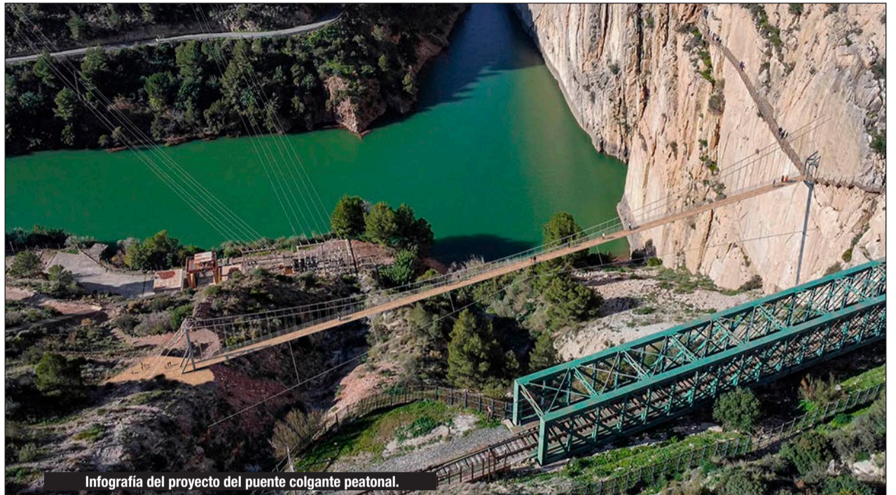
Infografía del proyecto del puente colgante peatonal.

TREN DE LA COSTA DEL SOL | El Ministerio de Transportes y Movilidad Sostenible ha recibido quince ofertas de empresas para realizar el estudio viabilidad del Tren Litoral o Tren de la Costa de Sol entre Nerja (Málaga) y Algeciras (Cádiz), licitado por 1,2 millones de euros. El plazo para presentar las ofertas se cerró el pasado lunes 10 de febrero. Así lo han dado a conocer fuentes del ministerio, que detallan que de las ofertas recibidas, siete se han presentado en UTE (Unión Temporal de Empresas). Así, entre las empresas que optan a la adjudicación del proyecto, las hay nacionales (de Málaga, Valencia, Vizcaya, Pontevedra o Madrid), y multinacionales. El contrato permitirá analizar soluciones de gran calado para mejorar la movilidad y la conectividad ferroviaria entre los municipios de la zona con el refuerzo de la línea C-1 de Cercanías entre la capital malagueña y la ciudad de Fuengirola, y su posible ampliación o extensión hacia el oeste, hasta la ciudad gaditana de Algeciras, y hacia el este, hasta Nerja, en la comarca de la Axarquía malagueña. El estudio de viabilidad se estructura en cinco tramos: uno hacia la Costa del Sol oriental, entre Málaga y Nerja, y cuatro hacia la Costa del Sol occidental: Málaga-Fuengirola, Fuengirola-Marbella, Marbella-Estepona, y Estepona-Algeciras.