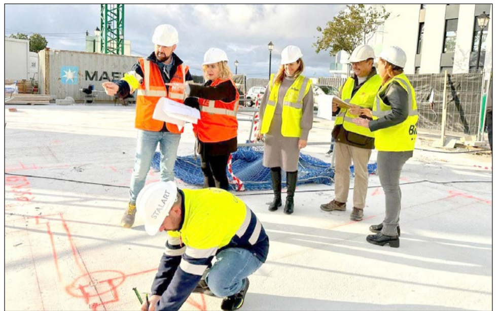
La alcaldesa durante la visita a las obras de las viviendas de Apoyo Municipal en Los Pacos.

iniciativa municipal asciende a 2.933.502,67 euros, de los que el 20% corren a cargo de los Fondos Europeos Next Generation. El plazo de ejecución de los trabajos es de 365 días naturales y están siendo acometidos por la empresa Bilba. Se trata de un edificio de quince apartamentos –siete de un dormitorio, siete de dos habitaciones, así como uno de tres- y 26 plazas de aparcamientos, todas ellas situadas en la planta sótano del inmueble. Se está erigiendo en un solar municipal, situado en la calle Alia-