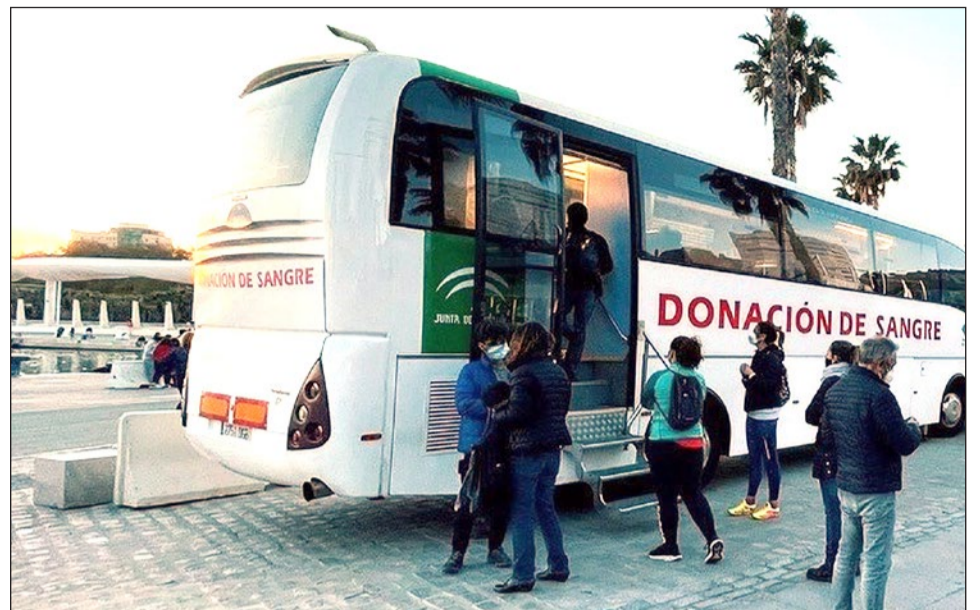
Una unidad móvil visitará Arroyo de la Miel los días 17 y 18 de febrero.

Los requisitos para poder donar sangre son: tener entre 18 y 65 años y un peso igual o superior a los 50 kilogramos; no padecer enfermedades crónicas ni tener una infección aguda; no tener anemia; y no realizar prácticas de riesgo que faciliten el contagio de enfermedades como, por ejemplo, hepatitis, sífilis y sida. Es obligatorio acudir con el DNI o documento