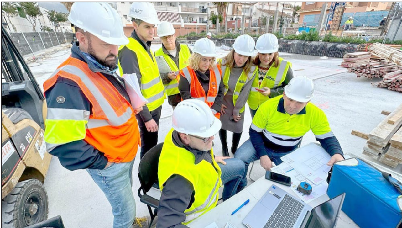
La alcaldesa, Ana Mula, en un momento de la visita a los trabajos de construcción de las Viviendas de Apoyo Municipal en Los Pacos.