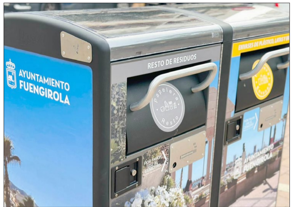
Fuengirola contará en breve con 27 nuevas papeleras inteligentes que se ubicarán en distintos puntos de la ciudad.

señalando que “son papeleras que están dotadas de