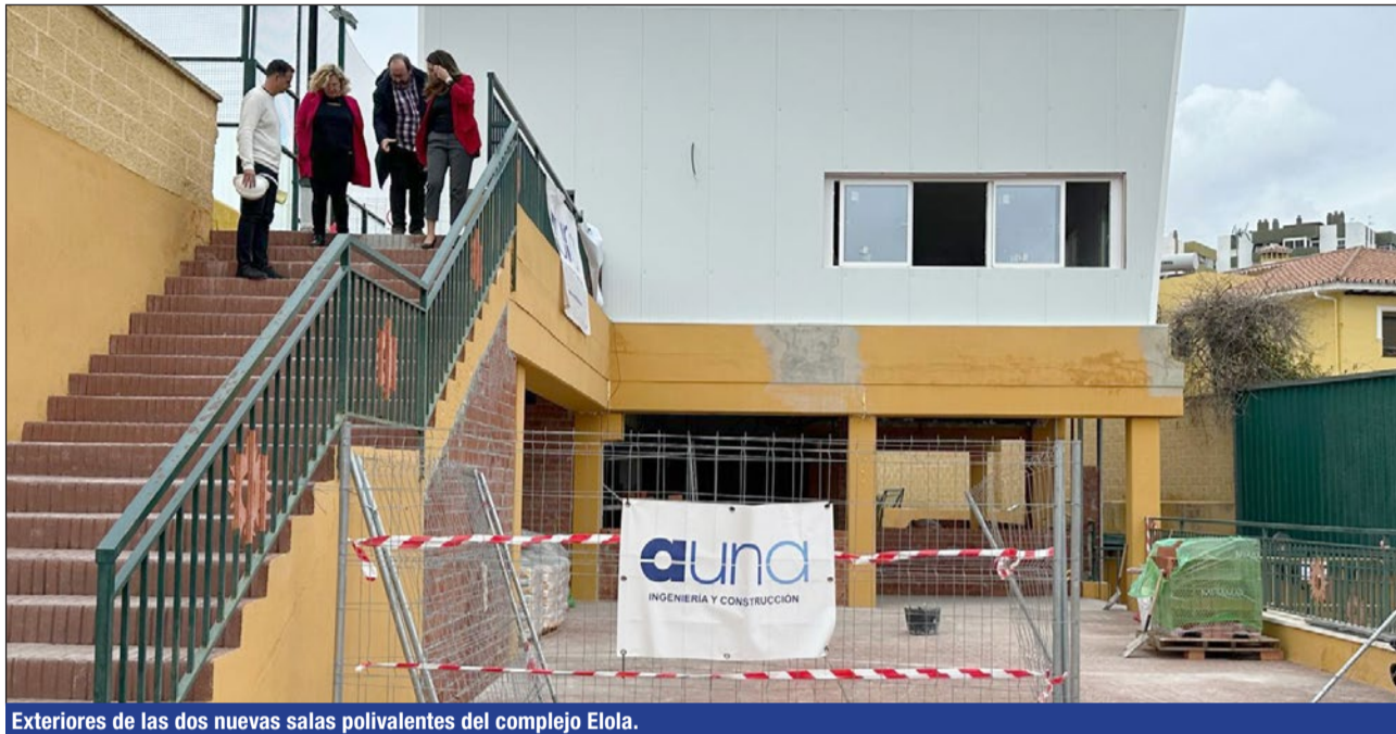
Exteriores de las dos nuevas salas polivalentes del complejo Elola.