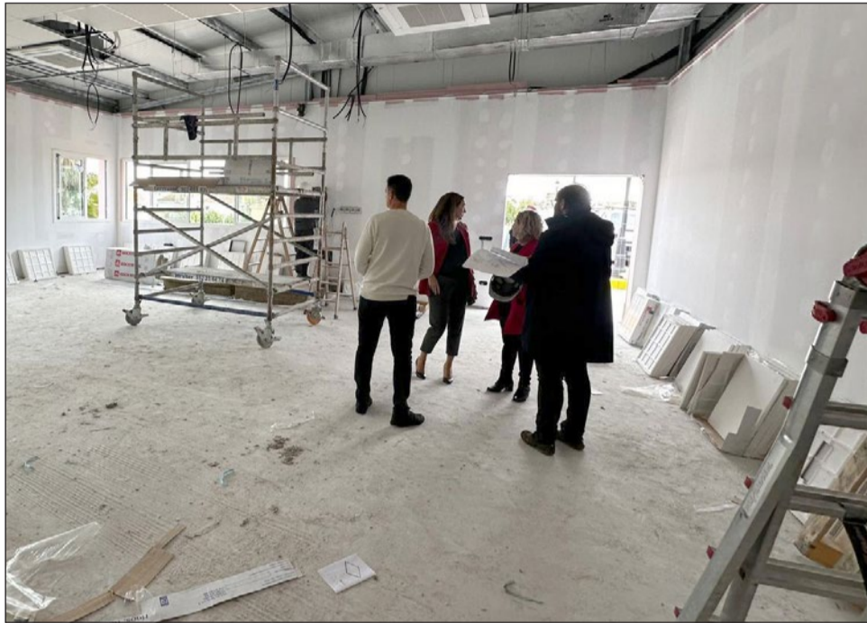
Interior de una de las salas polivalentes que se están construyendo en el complejo deportivo Elola.

Ambas salas, como subrayó la regidora, dispondrán de aire acondicionado, por lo que “cumpliremos con una demanda amplia de