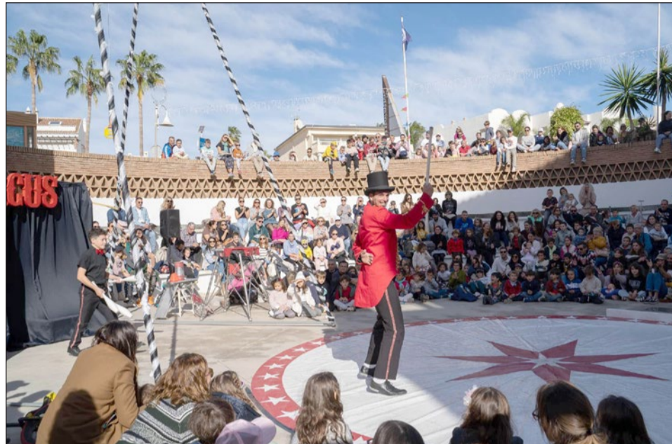
Espectáculo de circo del Plan de Dinamización 2023-2024.

A su vez, se creará una Tarjeta de Fidelización para los usuarios del Puerto de Benalmádena, a través de la cual se realizarán estrategias orientadas a consolidar la asistencia al recinto portuario no solo como enclave de embarque náutico, si no también como lugar de ocio y disfrute. La tarjeta la recibirán todos aquellos propietarios de embarcaciones en el Puerto de Benalmádena. Todo ello irá acompaña-