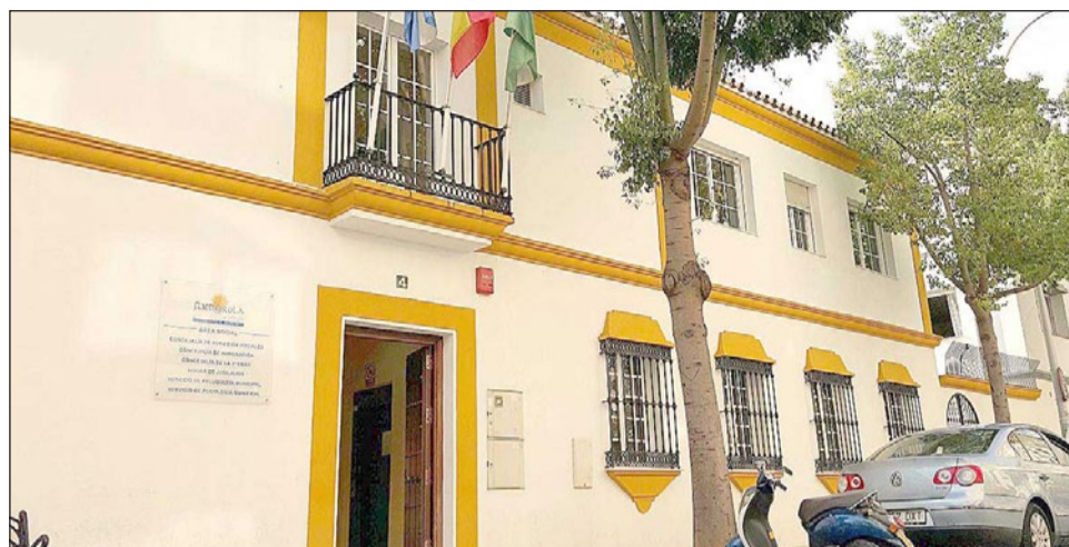
Hogar Social ubicado en la calle Blanca Paloma.

En este sentido, la edil señaló que “los menores que pueden participar en este programa van desde los tres a los dieciséis años. Las actividades que se realizan incluyen desde acompañamiento hasta actividades de ocio y recreativas, que ayudan a las familias a cubrir