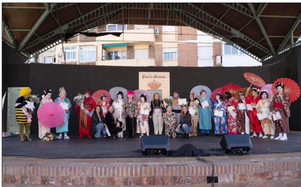
Actuación de agrupaciones y Carnaval de Mayores.