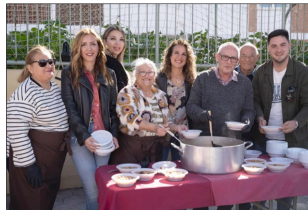
Degustación de callos carnavaleros.