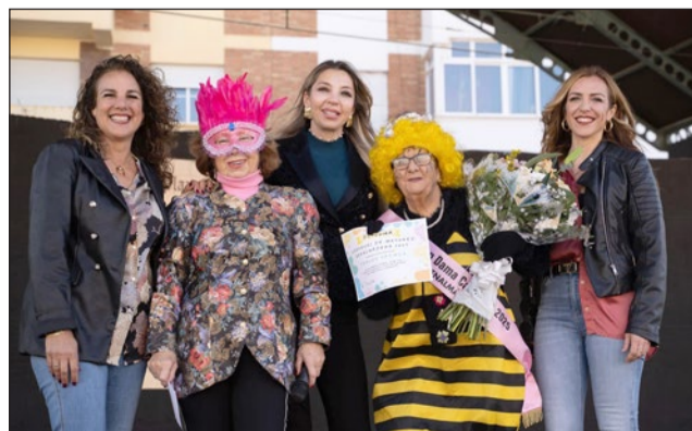
Concurso de Disfraces de mayores.