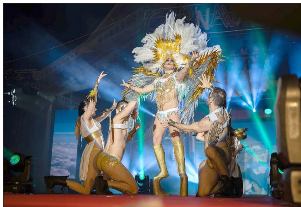
Momento de la Gala Drag Queen en su edición de 2024.