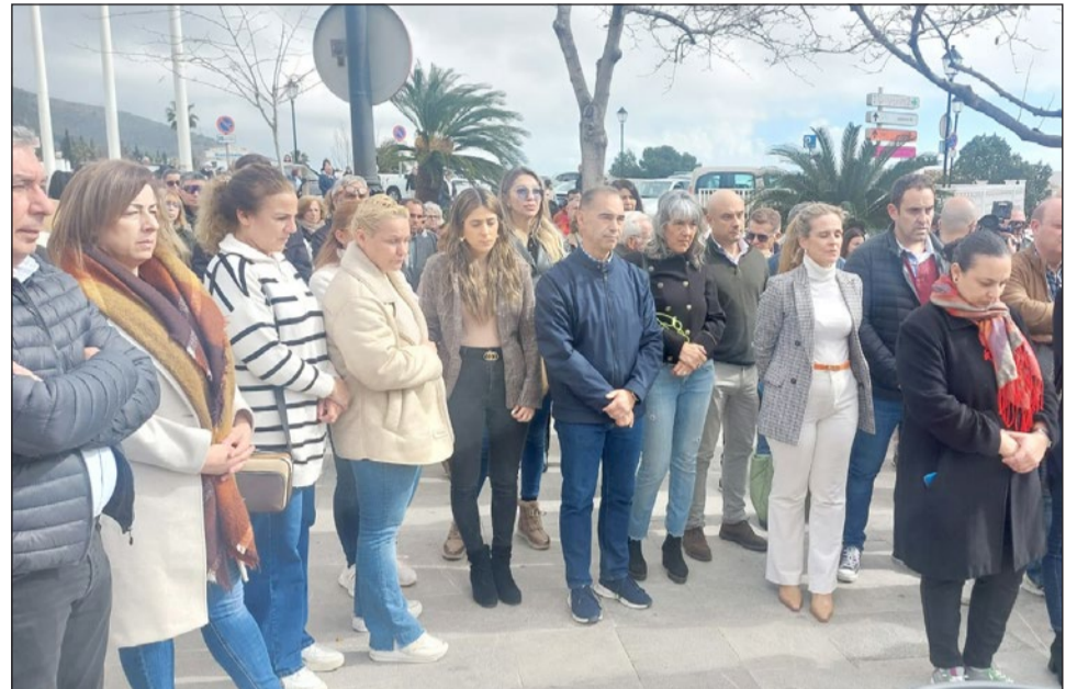
Concentración espontánea celebrada en la mañana del pasado domingo en la plaza de las Tres Culturas.

Es la segunda mujer asesinada por violencia de género en este 2025, la primera en Andalucía. Con la confirmación de este caso, el número de mujeres asesinadas por violencia de género en España asciende a 1.295 desde 2003, cuando se empezaron a recopilar estos datos. En Andalucía son 268 las mujeres asesinadas por violencia de género desde 2003. El