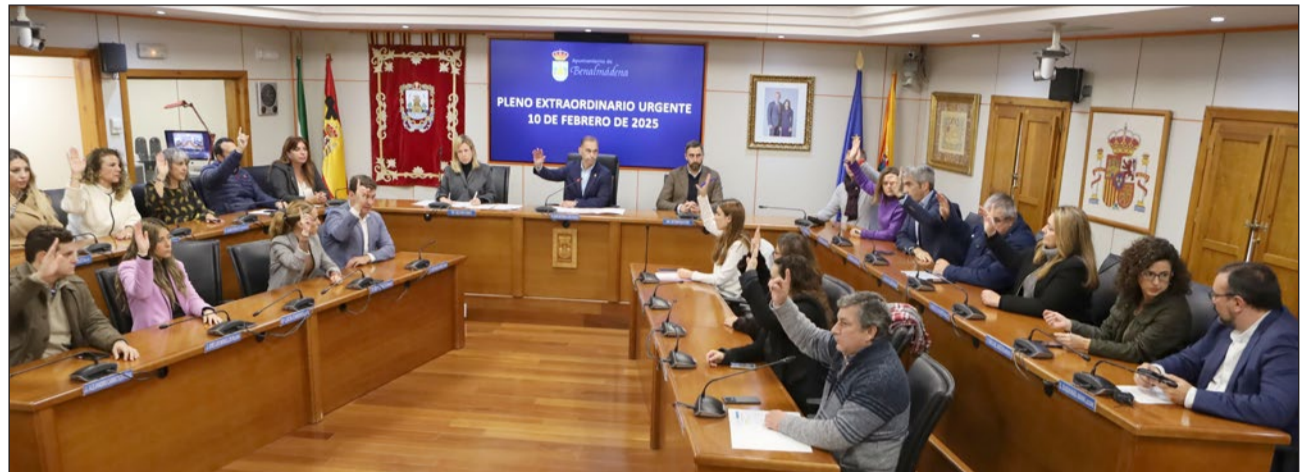
Momento de la sesión plenaria extraordinaria celebrada ayer donde se aprobó el manifiesto de repulsa por el crimen de Lina.

ción más extrema de violencia contra las mujeres tan presente en nuestros días”. “Como instituciones, estamos en el deber, la obligación y la responsabilidad de luchar de manera incansable por la búsqueda de una sociedad igualitaria. La erradicación de la violencia contra la mujer es responsabilidad de todos, implica el esfuerzo sin límites de cada ciudadano, institu-