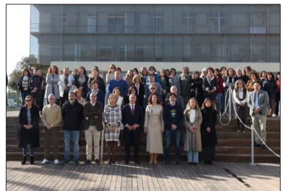
Minuto de silencio en la sede de la Diputación de Málaga.