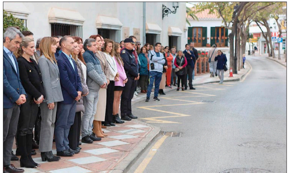
Minuto de silencio a las puertas del Ayuntamiento de Benalmádena.