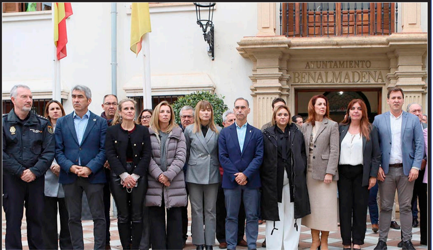
Momento del minuto de silencio que se guardó ayer a las puertas del Ayuntamiento.