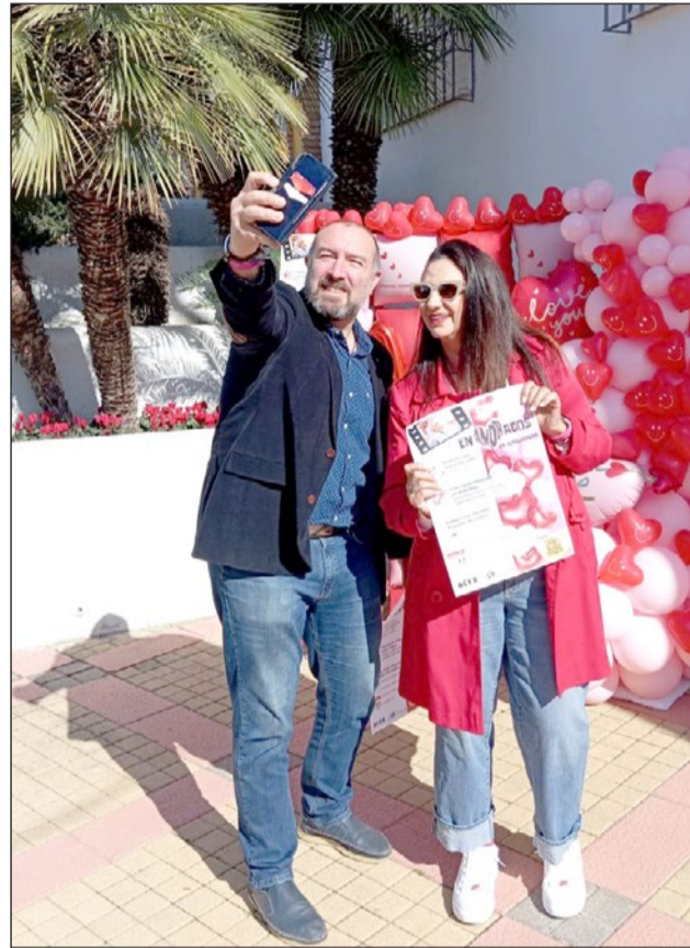
El punto 'selfie' está ubicado en la Casa de la Cultura de Arroyo.

El premio para la fotografía ganadora será un completo paquete de regalos consistente en un bono para un masaje anti estrés 'Brida' para dos personas en Linaloe Quiromasajista, un vale para 2 pasajeros para el Paseo Delfines o Ferry de Costasol Cruceros que incluye además un benjamín de cava, 2 invitaciones para el autobús turístico City Sightseeing Benalmádena, y una cena para dos personas en La Bella Sophia Pizzería de avenida Las Pal-