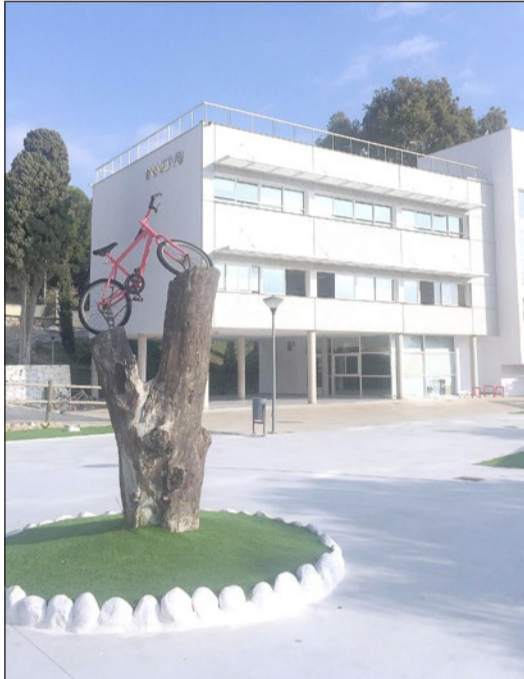
Edificio Innova, frente a la Biblioteca Arroyo de la Miel.