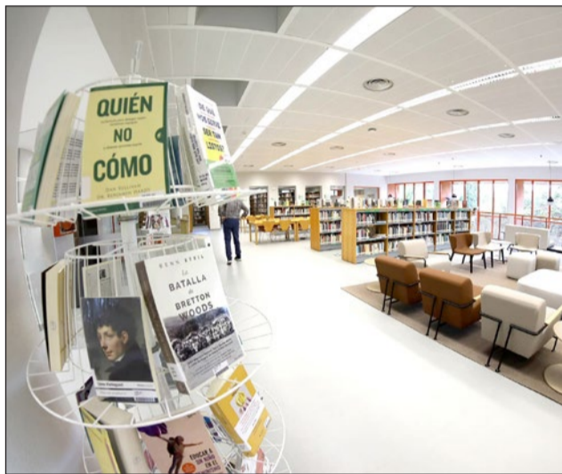
La entrada es libre hasta completar aforo.

Escritores es un festival organizado por la Cátedra Vargas Llosa con el apoyo de la Consejería de Cultura y Deporte, a través del Centro Andaluz de las Letras. Nació con la vocación de servir como bisagra que refuerce y revitalice el vínculo entre América y Europa en torno a las letras y la