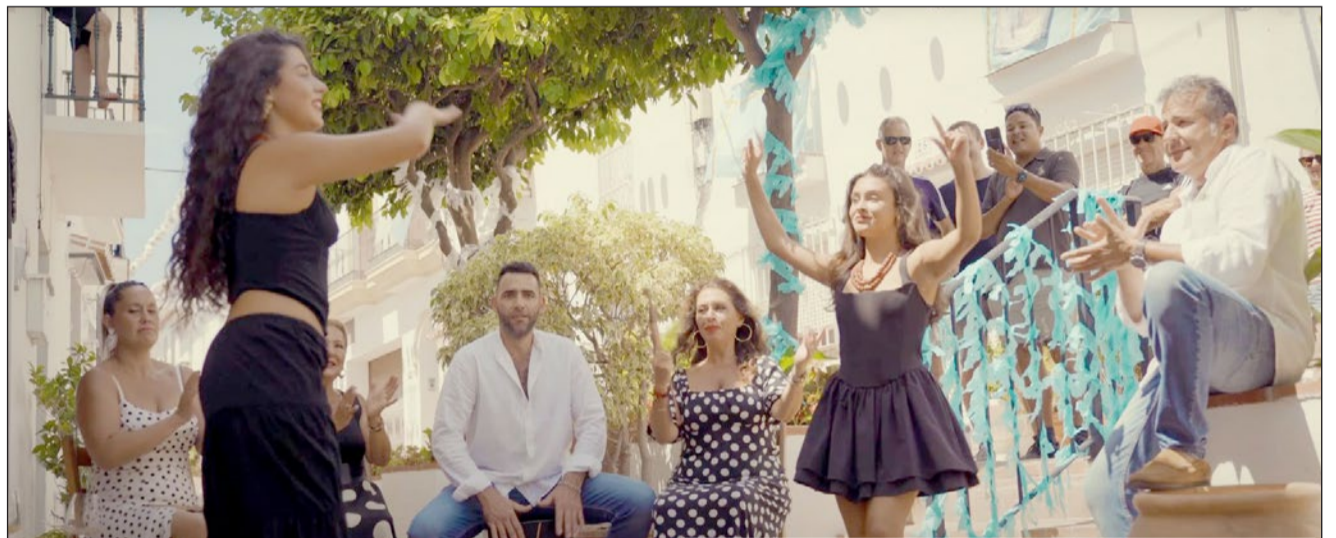
El spot de Benalmádena registra ya más de 3 millones de impresiones totales.

“Cabe destacar que esta campaña se diferencia de otras iniciativas turísticas apostando por la creatividad y la innovación. El spot trasciende la promoción convencional de destinos, explorando la dualidad entre el mundo digital y la experiencia real. En una era donde las decisiones de viaje se toman frente a una pantalla, Benalmádena se ha presentado en FITUR como un destino que “no solo brilla en internet, sino que también ofrece vivencias auténticas e inolvidables”, agregó el regidor.