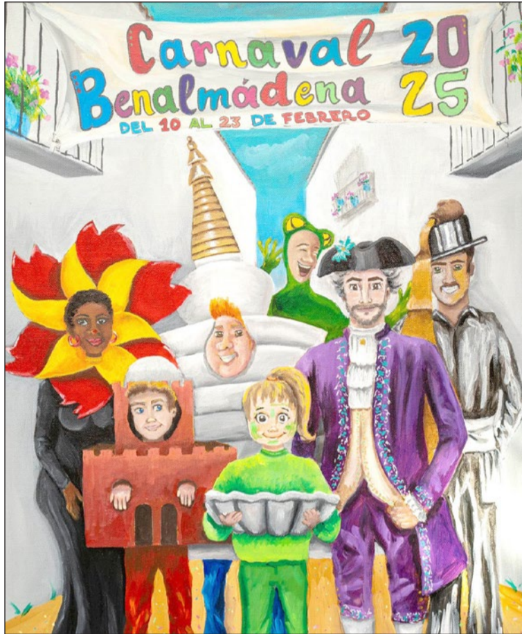
Cartel obra de Virginia Higuero Santos.

No faltará la Gran Fiesta (día 15) en la plaza de las Tres Culturas, la Gala Interescolar del Carnaval y el Desfile del Carnaval de los Mayores (día 16) ni la Gala Drag Queen (día 21), "un ejemplo de la diversidad que existe en nuestro municipio", señaló la concejala, destacando que el evento "cada año cuenta con una mayor afluencia de vecinos y visitantes, y además es pionero en la península".