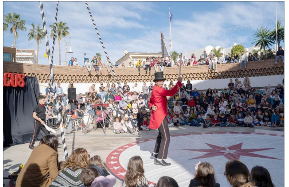
Espectáculo de circo del Plan de Dinamización 2023-2024.

A su vez, se creará una Tarjeta de Fidelización para los usuarios del Puerto de Benalmádena, a través de la cual se realizarán estrategias orientadas a consolidar la asistencia al recinto portuario no solo como enclave de embarque náutico, si no también como lugar de ocio y disfrute. La tarjeta la recibirán todos aquellos propietarios de embarcaciones en el Puerto de Benalmádena. Todo ello irá acompaña-