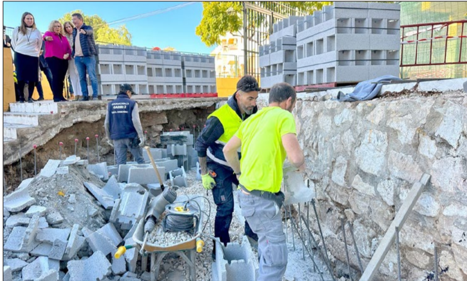
La alcaldesa visitó ayer las obras de renovación del pavimento del CEIP Los Boliches.

Así, las demás actuaciones de esta nueva planificación son: las labores de conservación de las nueve cubiertas de las pistas deportivas existentes; la renovación de las propias canchas de los centros Andalucía, Acapul-