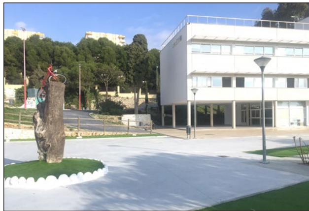
El Edificio Innova acogerá estos talleres.

El primero de estos talleres se impartirá el próximo 24 de enero y llevará por título “Introducción a la mentalidad emprendedora”. Aquí se analizará qué es la mentalidad