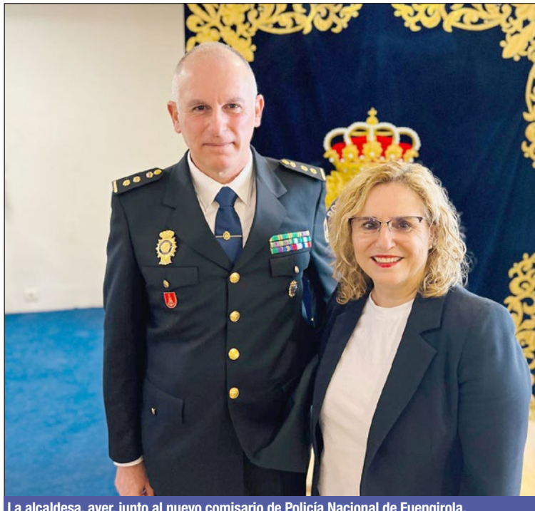
La alcaldesa, ayer, junto al nuevo comisario de Policía Nacional de Fuengirola.