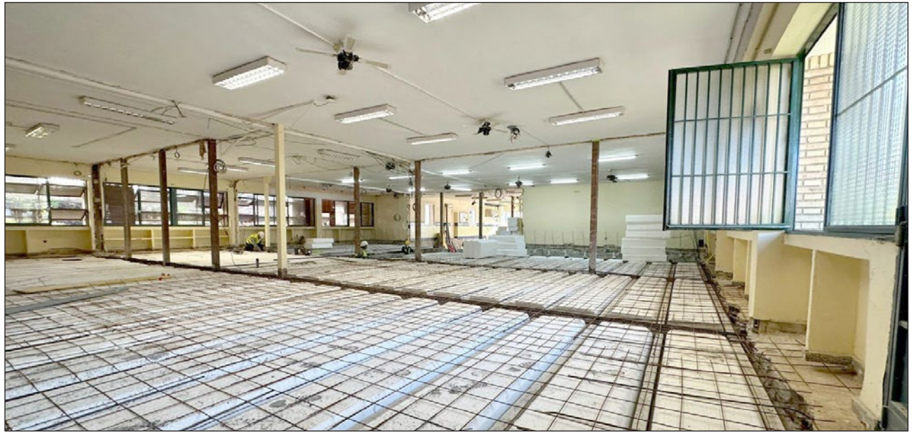
Imagen del forjado del pabellón del colegio Andalucía en el que está interviniendo el Ayuntamiento de la localidad.

De esta manera, el Consistorio ha movilizado 1.167.216,78 euros de su presupuesto municipal para esta actuación, que está llevando a cabo la empresa Maracof S. L. La intervención, que consiste en el