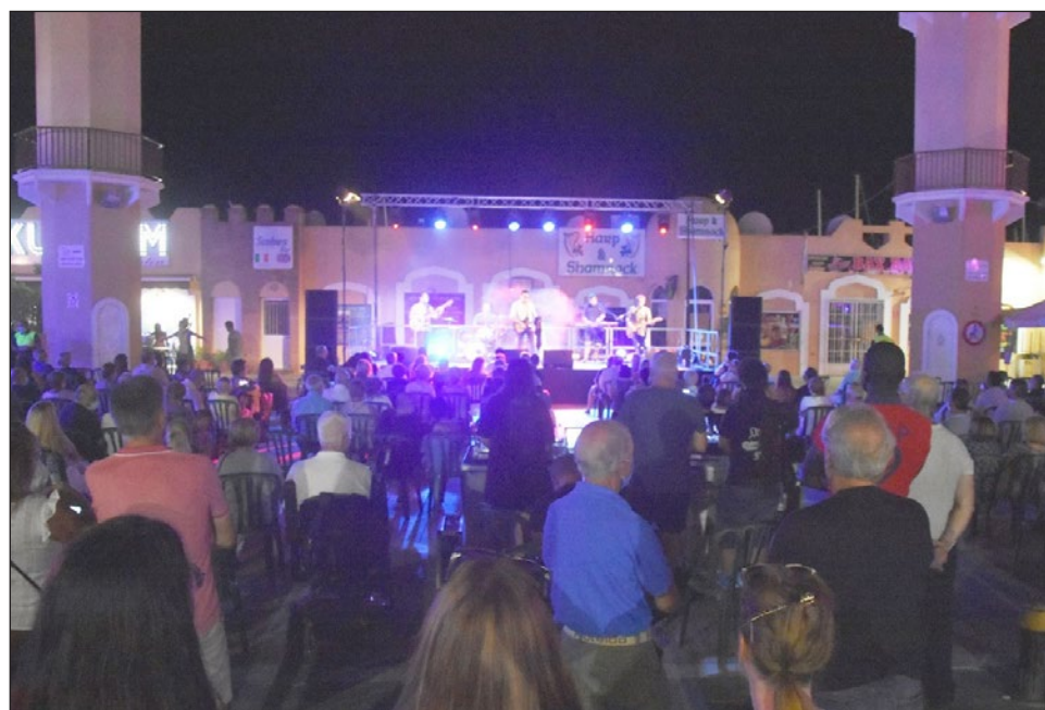
Este nuevo evento musical se celebrará en la plaza central del Puerto Deportivo.