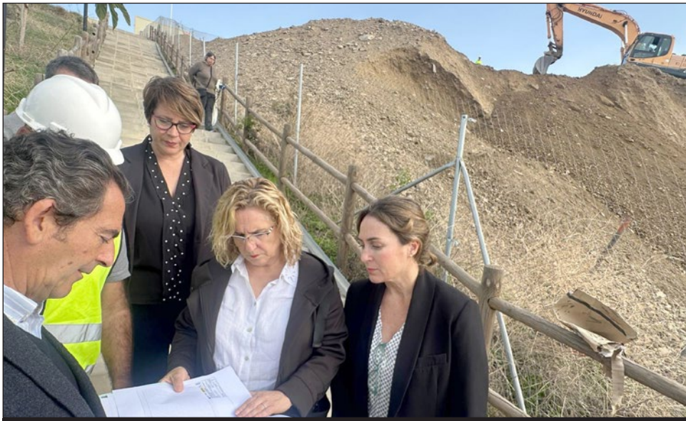
La alcaldesa atiende a las indicaciones sobre el plano de las viviendas de apoyo municipal.