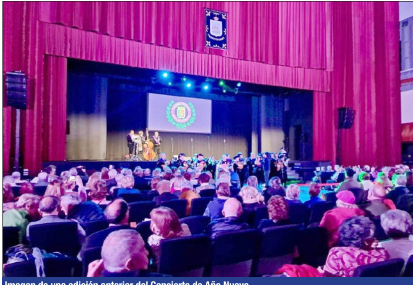
Imagen de una edición anterior del Concierto de Año Nuevo.

Así, las personas interesadas en asistir al Concierto de Año Nuevo, que tendrá lugar el día 14 de enero, a las 17.30 horas en el Palacio de la Paz deberán retirar sus invitacio-