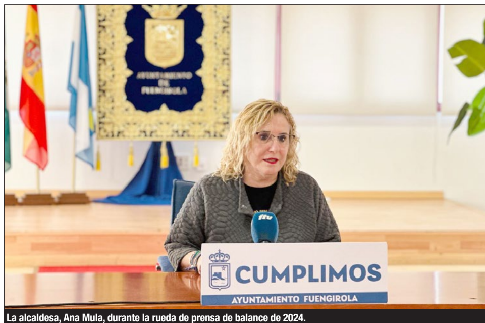
La alcaldesa, Ana Mula, durante la rueda de prensa de balance de 2024.

A este respecto, aseguró que durante el pasado ejercicio el ejecutivo que dirige ha iniciado iniciativas determinantes para el futuro de la ciudad, como el Nuevo Mercacentro, cuyas obras comenzaron al inicio del propio 2024. O el desarrollo del Plan Municipal de Acceso a la Vivienda con la entrega de 26 pisos de apoyo municipal en Los Pacos, así como el inicio de la construcción de otros 39 más. La mejora de conexiones viarias determinantes