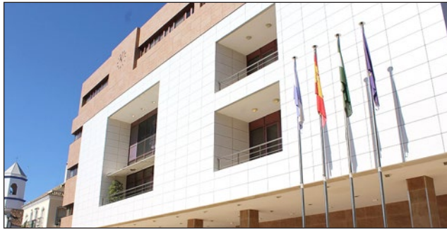
La oficina de la OMIC se encuentra ubicada en el Ayuntamiento.

“Una vez pasada la Navidad comienza la época de rebajas y desde el Ayuntamiento queremos recordar una serie de medidas que los vecinos deben tener en cuenta a la hora de adquirir algún tipo de produc-