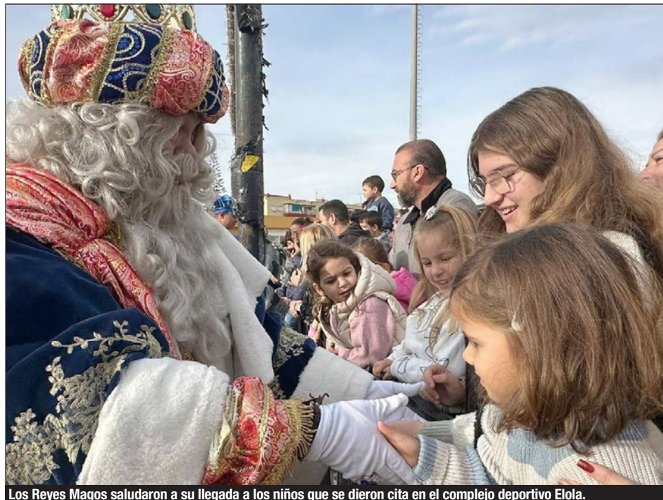
Los Reyes Magos saludaron a su llegada a los niños que se dieron cita en el complejo deportivo Elola.