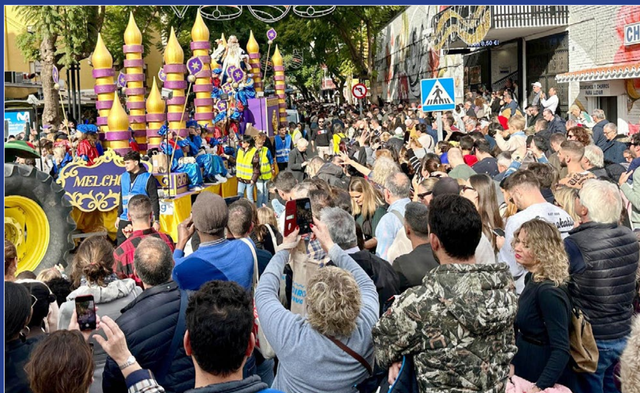
La Comitiva Real, una de las más extensas de Andalucía, ha estado compuesta este año por 25 carrozas y 11 pasacalles.

Durante su recorrido repartieron más de 30.000 kilos de caramelos