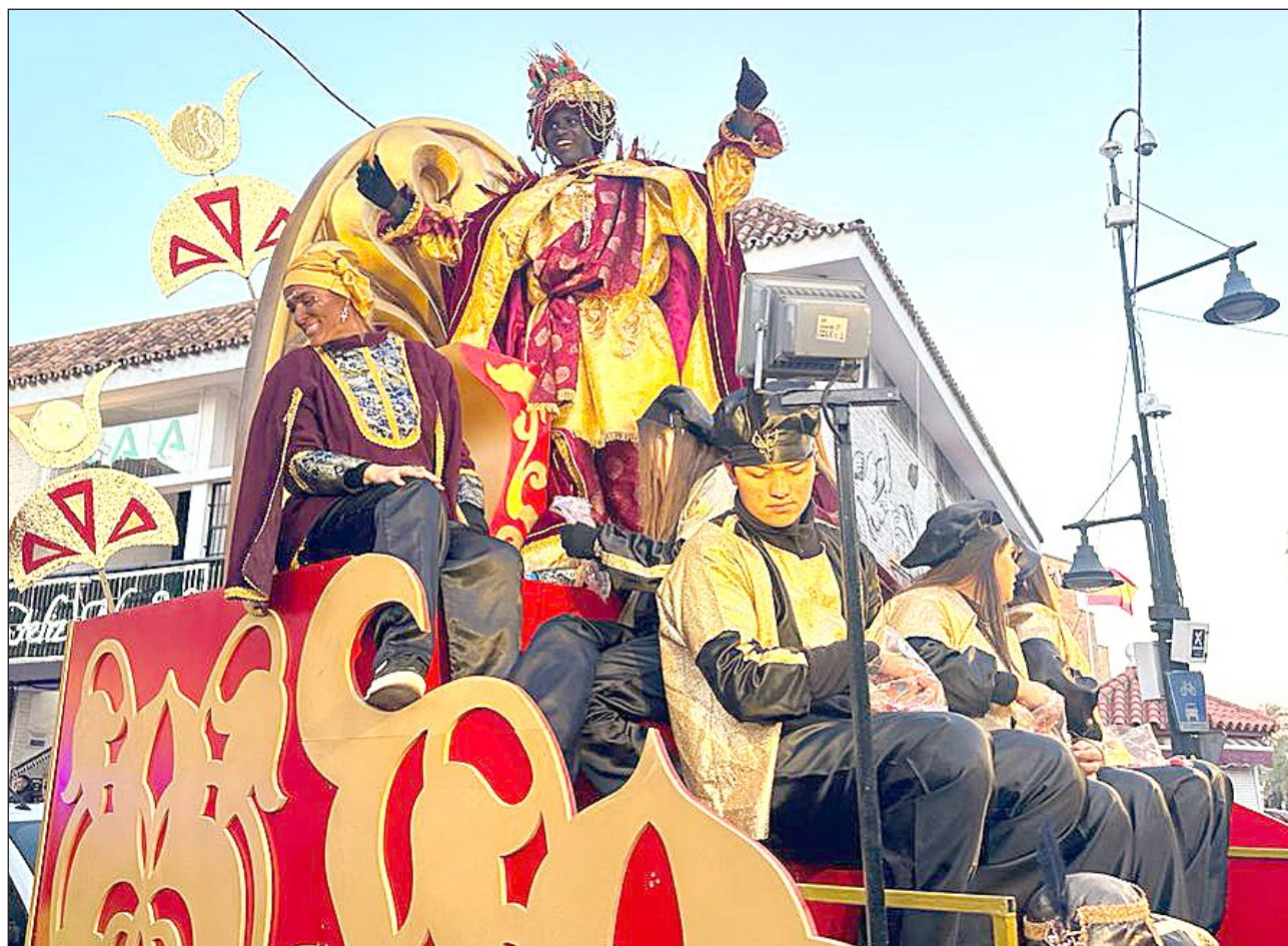
El itinerario de la Cabalgata comenzará a las 11.15 horas en la calle Mallorca de El Boquetillo y finalizará sobre las 15.15 horas en la plaza Pedro Cuevas.