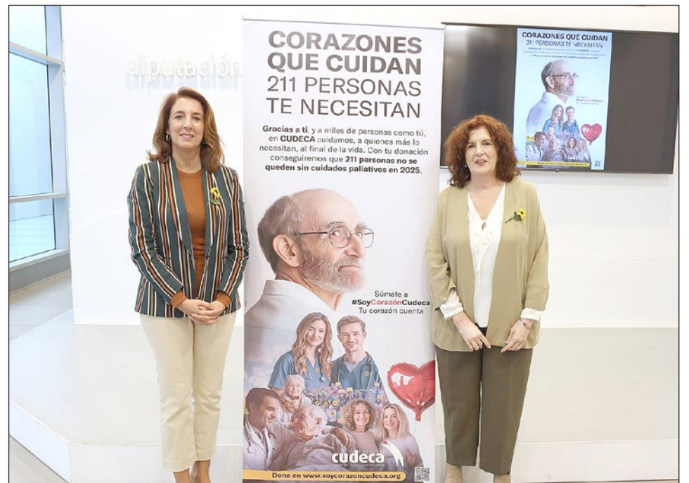
La Diputación de Málaga se ha sumado también a esta campaña.

Las formas de colaborar son a través de donación online en www.soycorazoncudeca.org ; o transferencia bancaria: ES11 2100 9032