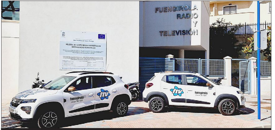
Nuevos vehículos eléctricos de Fuengirola Televisión (FTV).

que se han ido una a una definiendo el uso que se le va a dar y que se gestionan a través del panel de control que hay instalado en la Jefatura de Policía Local. Es un sistema que avisa a través de mensajes directos cuando ocurre algún accidente o si hay algún atasco y que nos permite prevenir situaciones, porque esa información que nos va llegando nos permite tomar medidas de antemano para evitar posibles atascos e incomodidades en la ciudad”.