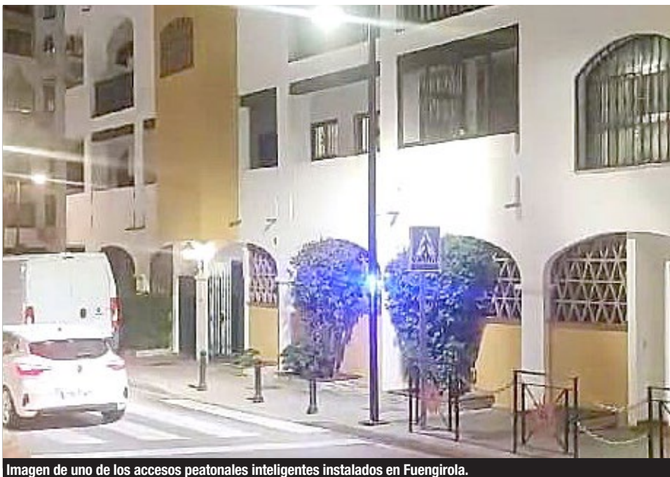
Imagen de uno de los accesos peatonales inteligentes instalados en Fuengirola.

En este sentido, González recordó que “todos los autobuses de la flota municipal son híbridos para cuidar de nuestro medio ambiente y reducir la contaminación. Además, también están dotados de desfibriladores, que permiten en casos de emergencia poder ayudar a quien lo necesite. Los autobuses incorporan además una tecnología que le