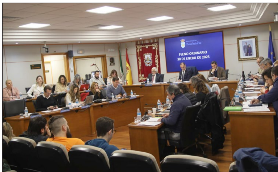
Imagen de la sesión plenaria correspondiente al mes de enero, celebrada ayer jueves.

“Estamos dando respuesta a la comunidad educativa y se están realizando actuaciones que hemos reclamado durante muchos años y que nos pedían los vecinos, obras que ya van a ser una realidad”, sostuvo el primer edil, que recordó que estas cuentas son “muy buenas para Benalmádena porque muchas de estas inversio-