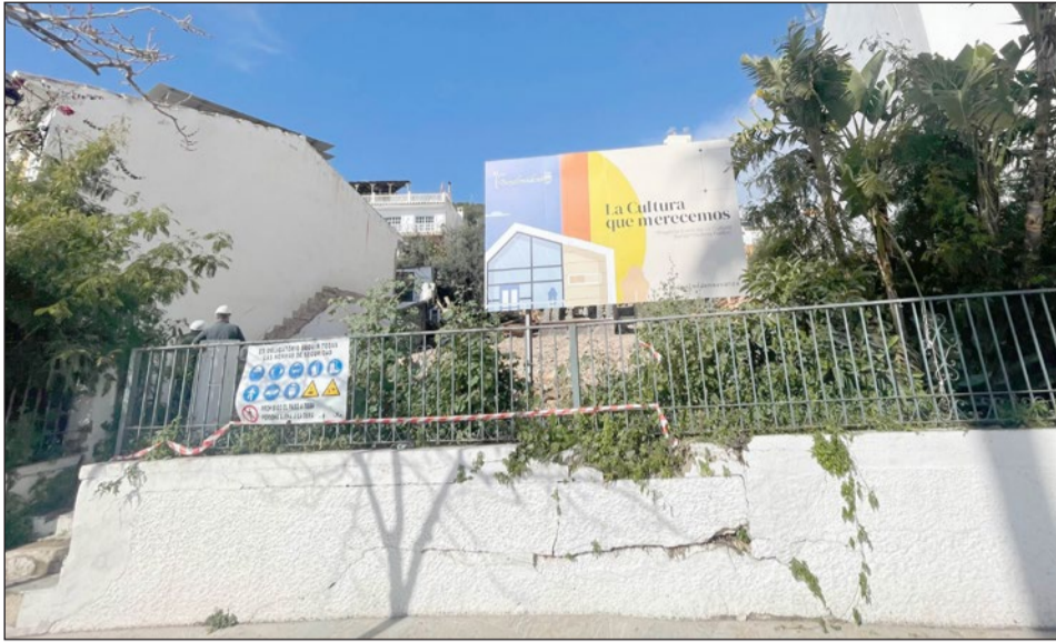
Este mes han culminado los trabajos de demolición en la parcela de la futura Casa de la Cultura del Pueblo.