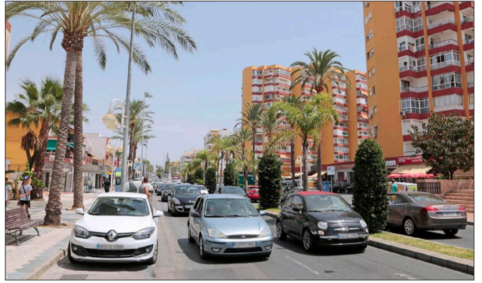
Se ha previsto impulsar el proyecto de transformación de la avenida Antonio Machado.