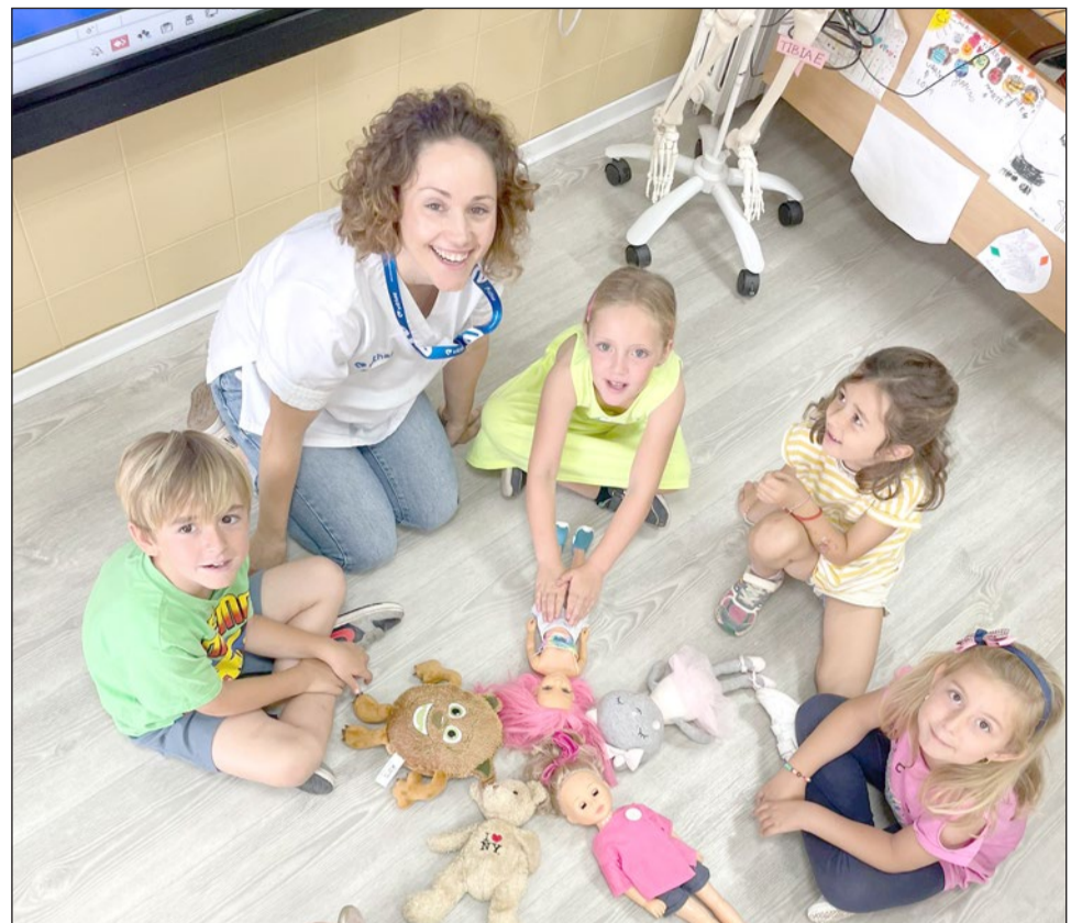
Salud mental y emocional, obesidad, técnicas de RCP o desarrollo corporal y sexual son algunos de los temas que impartirán los profesionales sanitarios.

Vithas Aula Salud Colegios se dirige a estudiantes