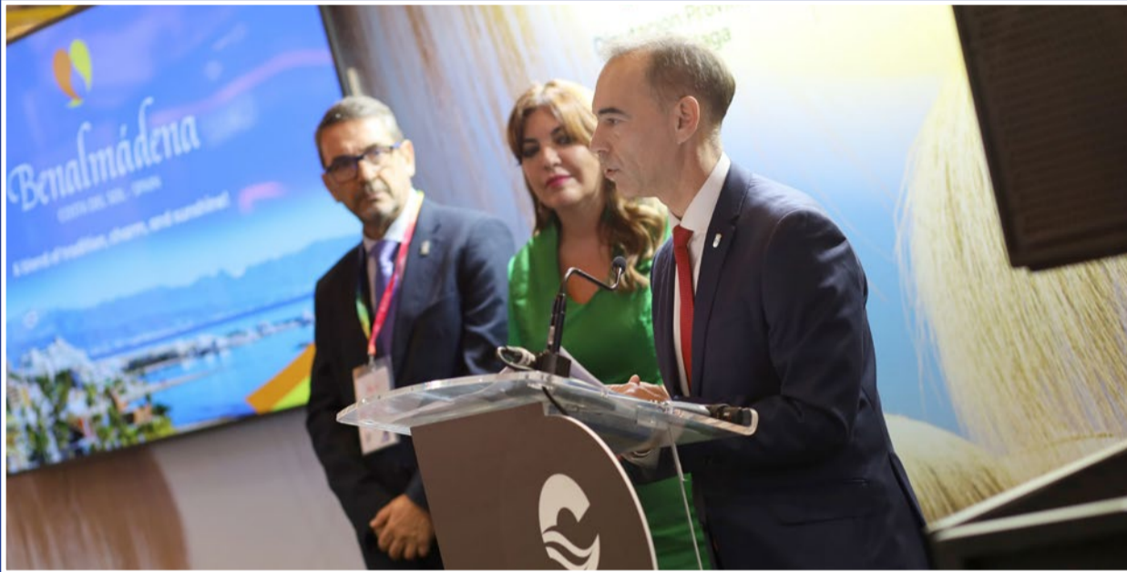
El alcalde, Juan Antonio Lara, durante la presentación de Benalmádena estos días en la Feria Internacional de Turismo.