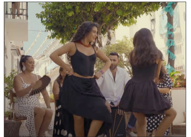
Momento del spot.