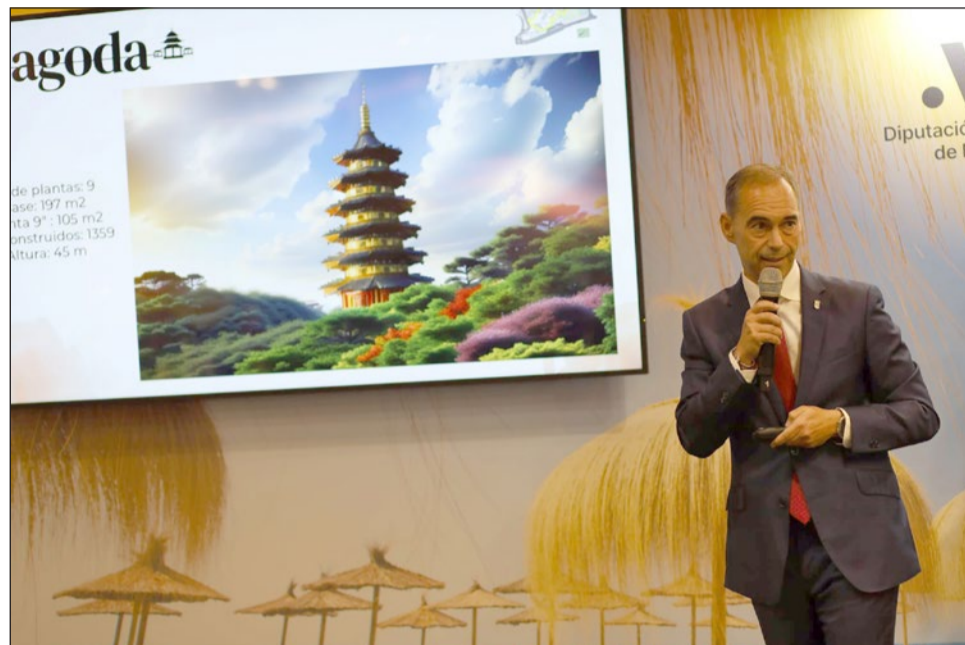
El alcalde ha realizado la presentación del proyecto en FITUR.

El objetivo es “trasladarnos a la China más tradicional a través de un lugar donde prima la naturaleza, la espiritualidad y sus típicas celebraciones, todo ello sin necesidad de salir de Benalmádena, atrayendo no solo al turista chino, muy importante ahora mismo por su exponencial crecimiento, sino también a todos aquellos visitantes y población en general del entorno que quieran disfrutar de un enclave que no existe ahora mismo en todo nuestro continente”,