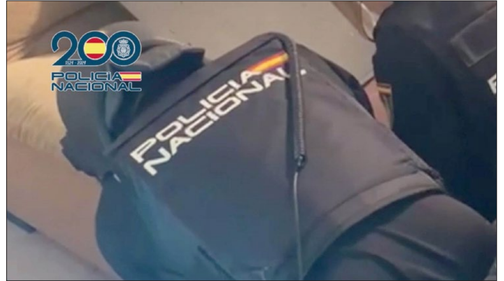
La Policía Nacional ha detenido a cinco personas en esta operación.

Además, en la denuncia la víctima refirió que unos días antes, realizando la misma ruta de recogida de recauda-