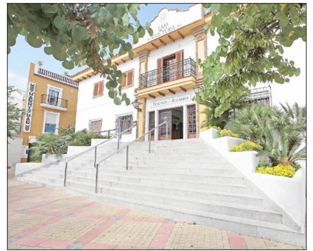
La charla se celebrará en la Casa de la Cultura.

Respecto al protagonista, cabe recordar su prometedor carrera en la música clásica, que fue truncada por la Guerra Civil, obligándole a reinventarse como compositor de pasodobles, música para el NO-DO y, sobre todo, como uno de los más prolíficos compositores de bandas sonoras del cine español. Un naufragio, la determinación por crear, la lucha por sobrevivir, el éxito y el fracaso y un trágico final son los ingredientes de esta historia que se pondrán de manifiesto hoy martes con este Cinefórum en Benalmádena.