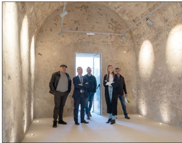
Al ser un edificio de carácter histórico, los trabajos han seguido las directrices de la Ley de Patrimonio Histórico de Andalucía.

En los trabajos y debido a que se trata de un edificio de carácter histórico, ha intervenido la empresa Chapitel S.L., el equipo de arqueología de Astarté Estudios de Arqueología S.L., siguiendo las directrices sobre la Ley de Patrimonio Histórico de Andalucía, con la mirada puesta en la correcta intervención en paramentos y construcciones originales, lográndose recuperar diferentes ventanas que estaban cegadas,