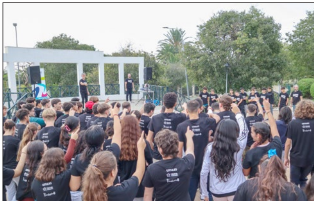
Actividad de clausura a cargo de DA.TE Danza.

En esta charla, los asistentes aprenderán qué es la salud mental y por qué es importante para cada persona y para sus hijos e hijas, además indagar para saber