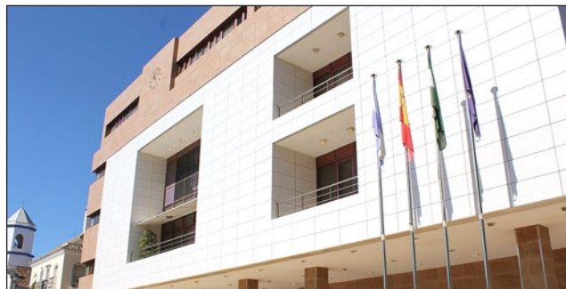
La oficina de la OMIC se encuentra ubicada en el Ayuntamiento.

“Una vez pasada la Navidad comienza la época de rebajas y desde el Ayuntamiento queremos recordar una serie de medidas que los vecinos deben tener en cuenta a la hora de adquirir algún tipo de produc-