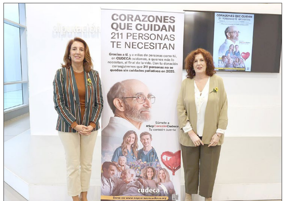
La Diputación de Málaga se ha sumado también a esta campaña.

Las formas de colaborar son a través de donación online en www.soycorazoncudeca.org ; o transferencia bancaria: ES11 2100 9032