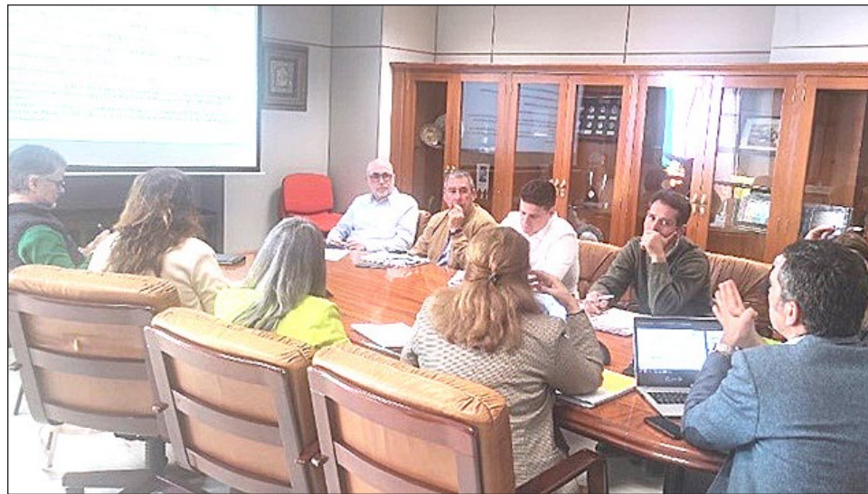
Reunión técnica del Plan de Actuación Integrado celebrada el pasado mes de abril.

Para participar es necesario acceder a la web municipal a través del siguiente enlace: https://www.benalmadena.es/agenda-urbana/participacion .