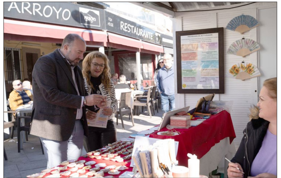
Centro Comercial Abierto de Benalmádena.

Por su parte, el edil de Comercio informó sobre la campaña 'Aparca fácil y compra cerca', que contempla el reparto de 1.200 vales por 8 horas de aparcamiento gratuito en el parking de Pueblosol (en horario comercial). Esta iniciativa, que cuenta con el apoyo económico de la Consejería de Empleo, Empresa y Trabajo Autónomo de Junta de Andalucía, persigue que los clientes puedan aparcar gratis si realizan sus compras en los comercios asociados del