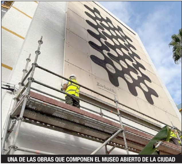
UNA DE LAS OBRAS QUE COMPONEN EL MUSEO ABIERTO DE LA CIUDAD

tas al patrimonio municipal, como el Castillo Sohail o la Finca del Secretario.