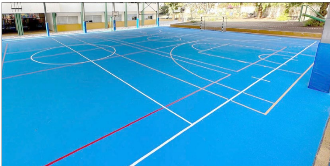
Imagen de la pista deportiva del colegio Acapulco tras la renovación de su pavimento.

hecho una apuesta importante y clara por los centros de educativos de Fuengirola para que presenten el mejor estado de mantenimiento; y es que a las tareas habituales se han sumado labores especializadas”, explicó Díaz, señalando que “dentro de los trabajos de limpieza, mantenimiento y pequeñas actuaciones de reparación que realizan los conserjes de los once centros escolares de Fuengirola, que se hacen de manera continuada a lo largo del año, se han llevado a cabo más de 3.500 actuaciones”.