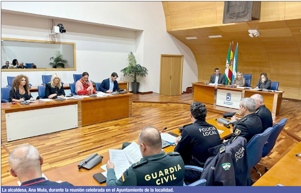
La alcaldesa, Ana Mula, durante la reunión celebrada en el Ayuntamiento de la localidad.