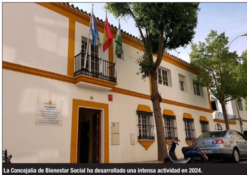
La Concejalía de Bienestar Social ha desarrollado una intensa actividad en 2024.

En este sentido, el Área de Bienestar Social ha realizado 9.394 aten-