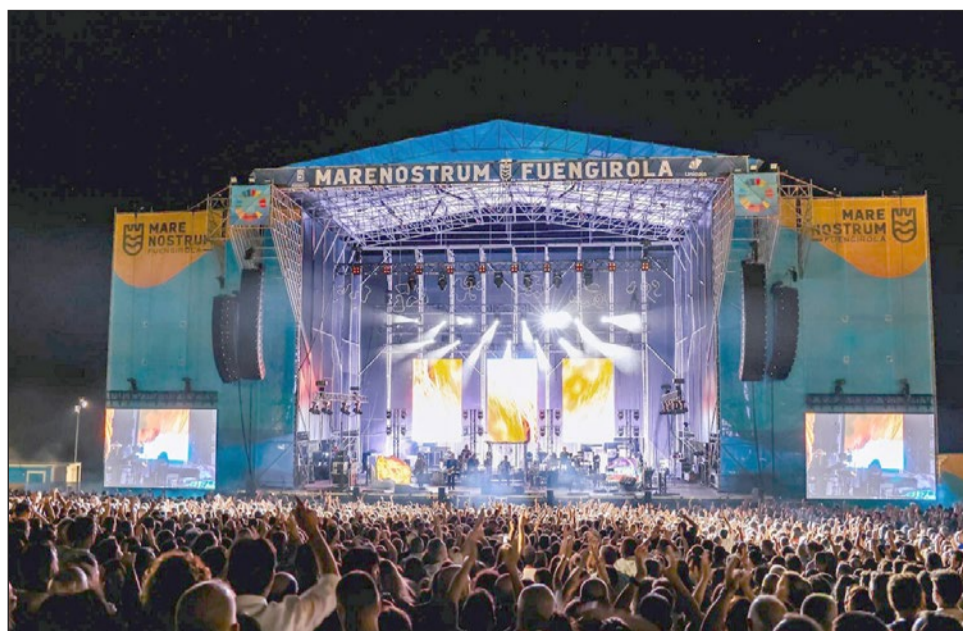
Marenosttrum Fuengirola prepara un atractivo programa de conciertos con motivo de su décimo aniversario.