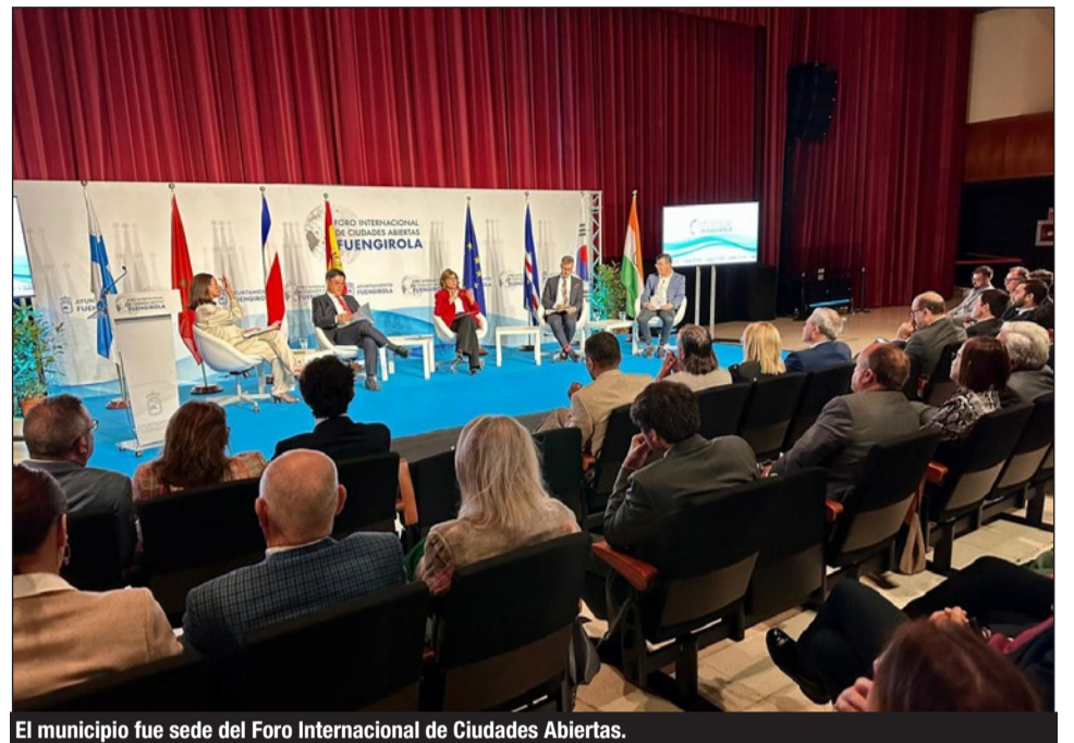
El municipio fue sede del Foro Internacional de Ciudades Abiertas.

Para concluir, el edil manifestó que “el Turismo