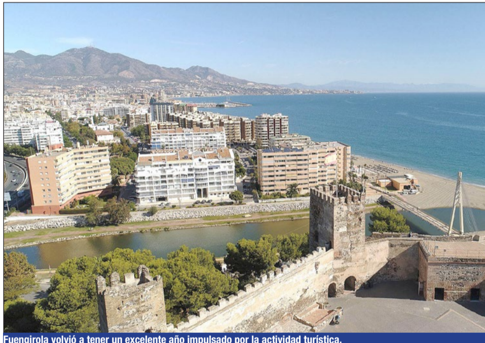
Fuengirola volvió a tener un excelente año impulsado por la actividad turística.

“El turismo es la industria más importante de Fuengirola, la mayor generadora de empleo y dinamismo económico de la ciudad. El turismo en Fuengirola se mueve tanto desde el ámbito privado, con nuestros hoteles, gastronomía, ofertas de ocio... también