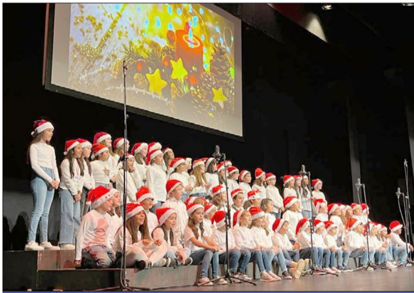
Imagen de una sesión anterior del Certamen de Villancicos Escolares.

En este sentido, la edil indicó que “es importante que las familias sepan que el alumnado tendrá que estar como muy tarde a las 17:15 horas en el acce-