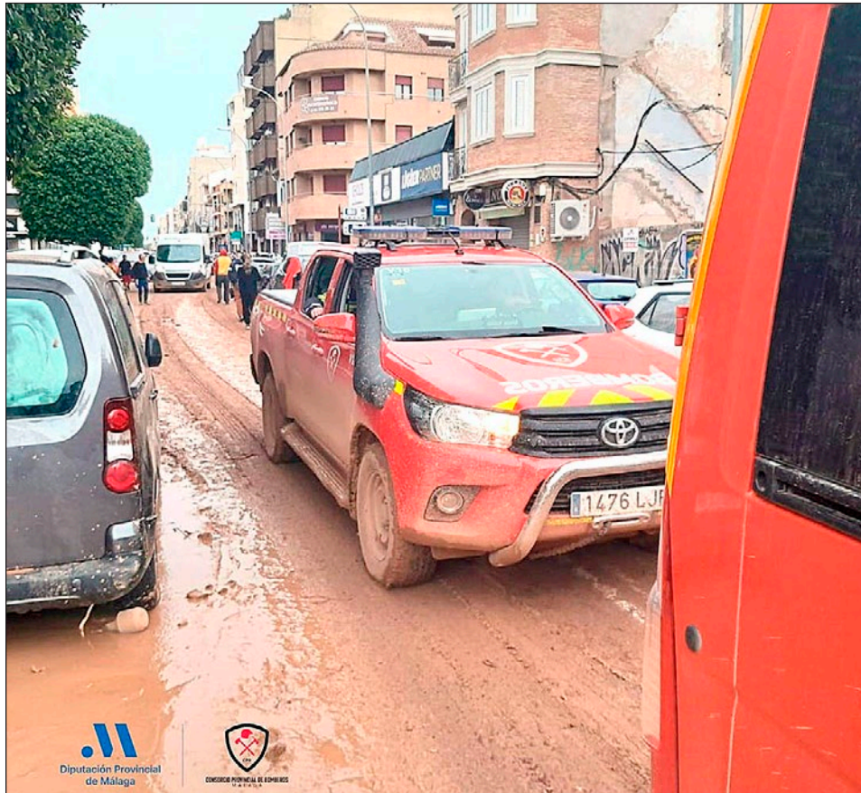
Bomberos del CPB trabajan en Valencia para apoyar en labores de búsqueda y rescate de personas.

En este sentido, ha detallado que han conseguido