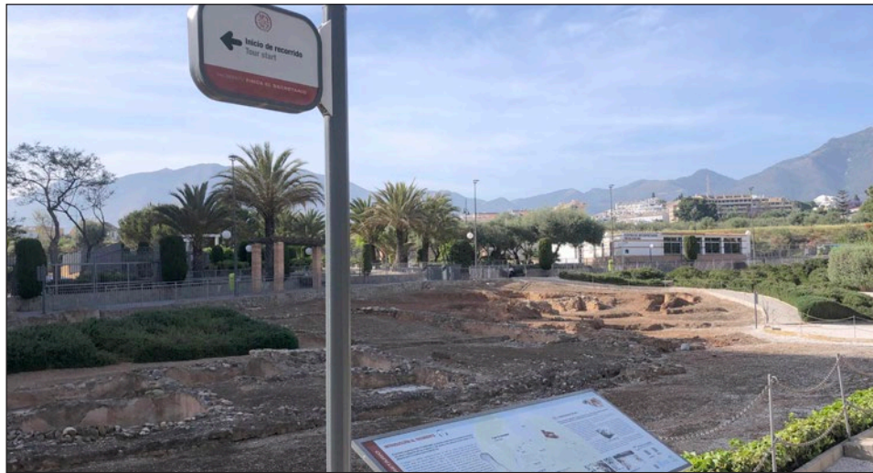
Imagen del yacimiento arqueológico Finca del Secretario.