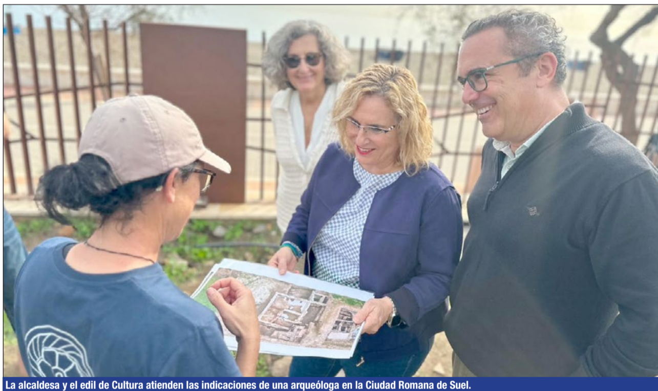
La alcaldesa y el edil de Cultura atienden las indicaciones de una arqueóloga en la Ciudad Romana de Suel.