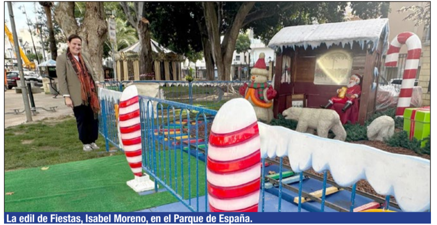
La edil de Fiestas, Isabel Moreno, en el Parque de España.