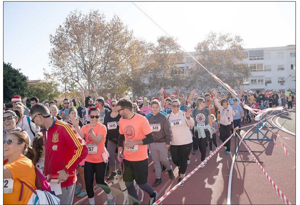
Imagen de la Carrera del Pavo del pasado año 2023.

el objetivo de fomentar la carrera dentro de la población de Benalmádena, buscando, sobre todo, que los participantes y la población descubran y sientan el placer de correr. Dado el carácter popular y con ánimo de incentivar la participación, puede hacerse también caminando.