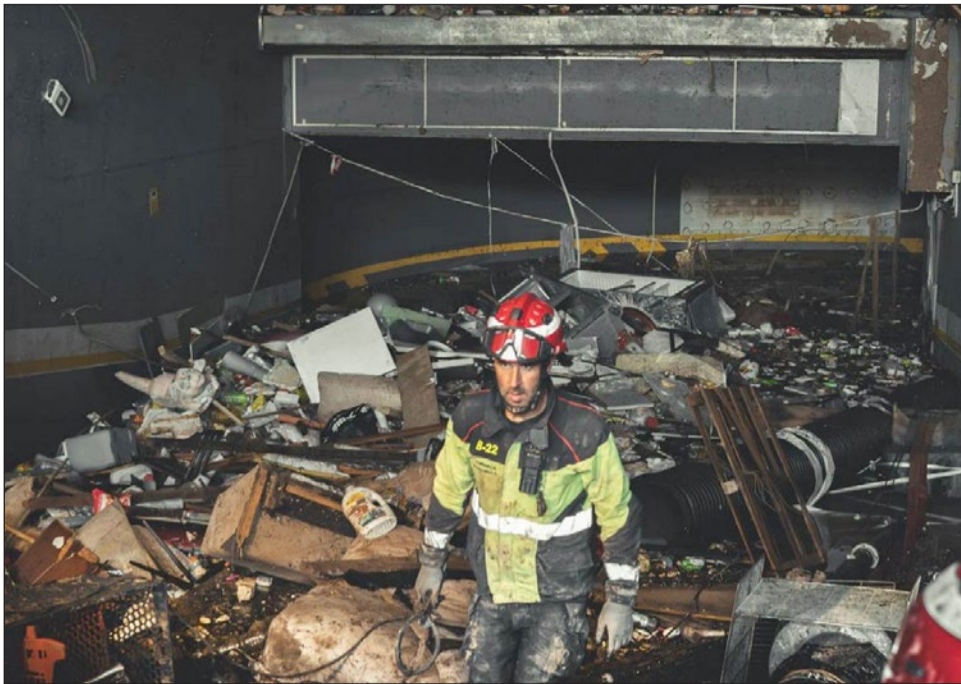
Uno de los bomberos de Fuengirola sale de un sótano en una de las poblaciones de Valencia afectadas por la DANA.