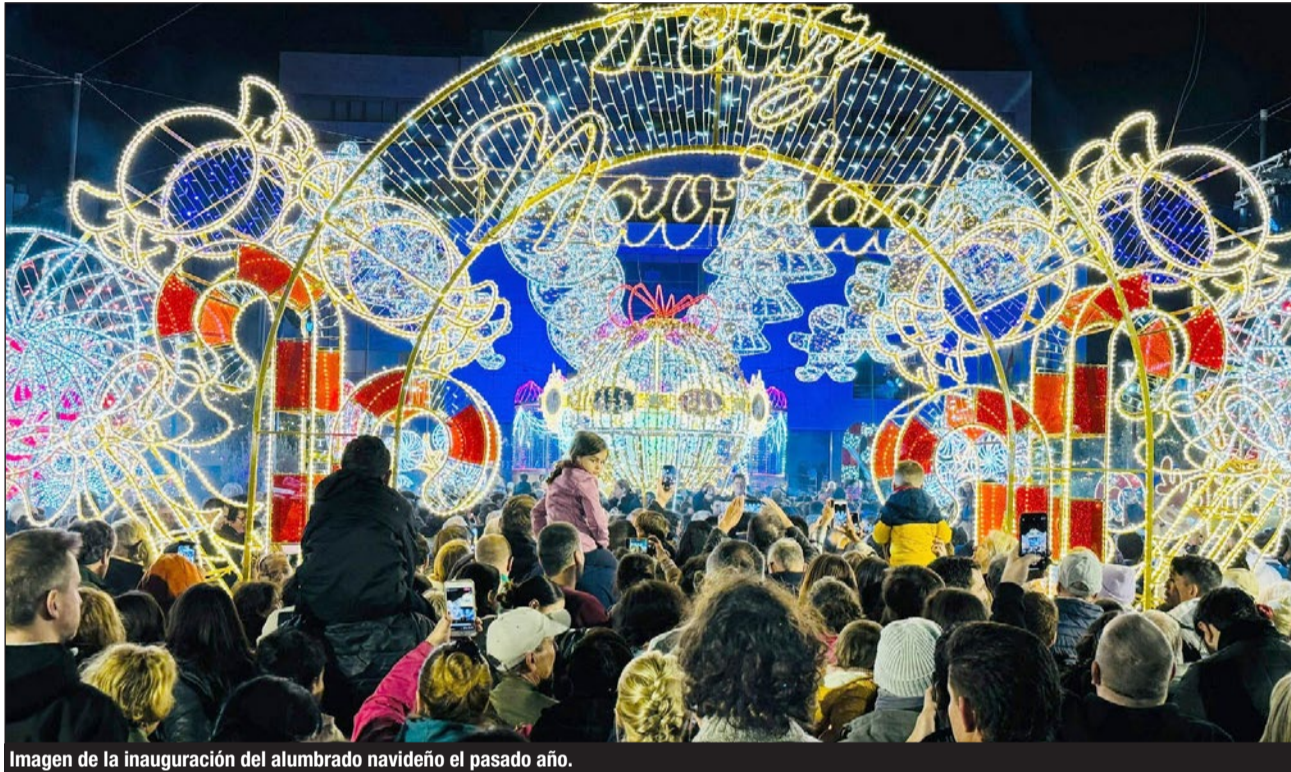
Imagen de la inauguración del alumbrado navideño el pasado año.