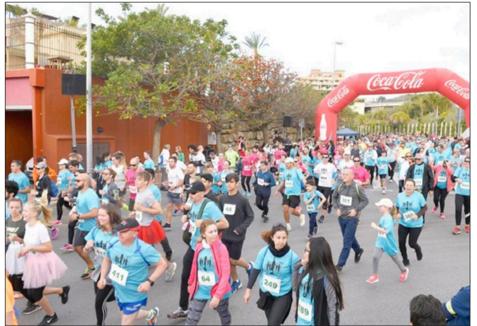
Imagen de una edición anterior de la prueba.

Se corre por el paseo marítimo, a la altura del hotel Tritón, se baja a la playa por las maderas y se entra por el Club Náutico a Puerto Marina. Se darán dos vueltas a Puerto Marina, teniendo los corredores que coger una pulsera al final de la 1ª vuelta, que certifica su paso. Después de la 2ª vuelta, se baja a la playa por el Club Náutico, se sube por el hotel Tritón, se regresa por