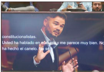
constitucionalistas. Usted ha hablado en euskera y me parece muy bien. No ha hecho el canelo. No sé.

La Mesa del Congreso ya analizó las conclusiones de la Junta de Contratación de la Cámara el día 29 de octubre, en una sesión a la que el PP no acudió porque decidió suspender su actividad parlamentaria por la tragedia provocada por la DANA que había asolado varias localidades de la provincia de Valencia la víspera. En cualquier caso, los 'populares' se han venido oponiendo a toda la tramitación de este contrato desde la apertura del concurso para su adjudicación.