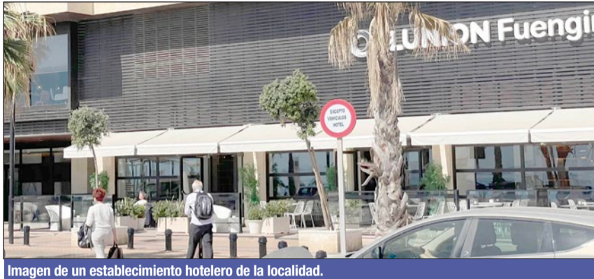
Imagen de un establecimiento hotelero de la localidad.

El presidente de Aehcos, José Luque, ha señalado que "desde el sector hotelero estamos satisfechos con los resultados de ocupación obtenidos". "Los