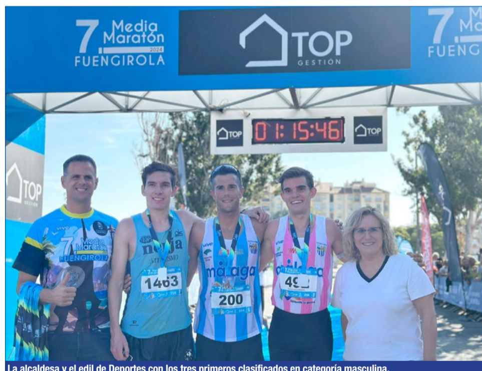
La alcaldesa y el edil de Deportes con los tres primeros clasificados en categoría masculina.