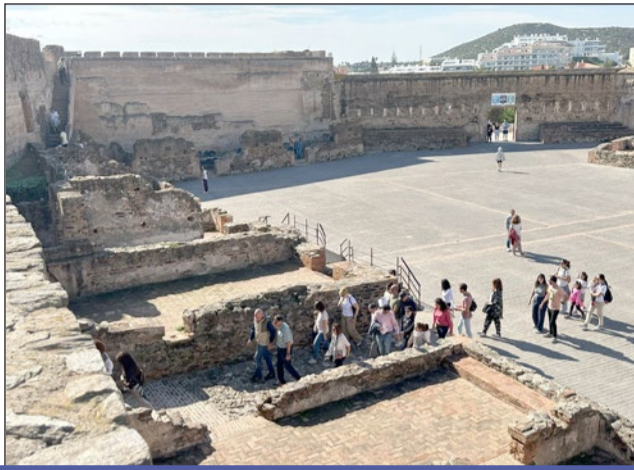
Los arqueólogos encargados de este proyecto ofrecieron a los asistentes todo tipo de detalles e información sobre esta fortaleza y su historia.