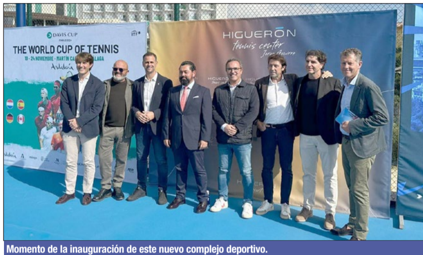
Momento de la inauguración de este nuevo complejo deportivo.