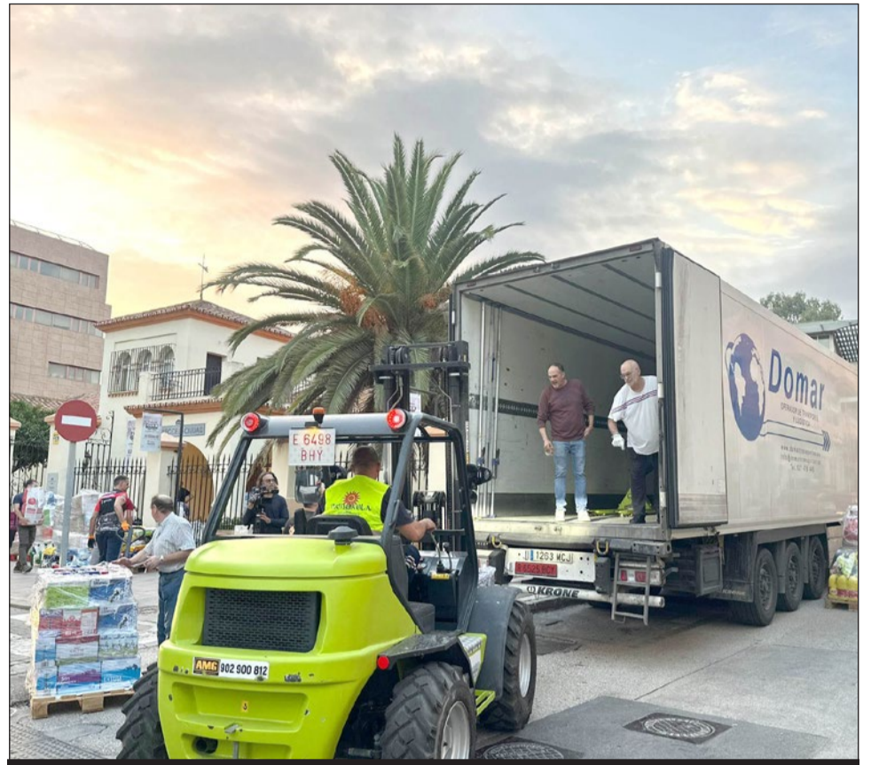
Momento de los trabajos de carga del primero de los tráilers que han partido para Valencia.