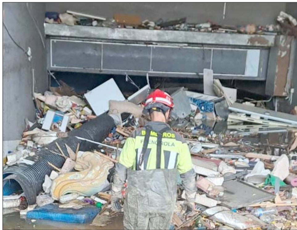
Un bombero de Fuengirola en la entrada de un parking de un centro comercial afectado por el temporal.