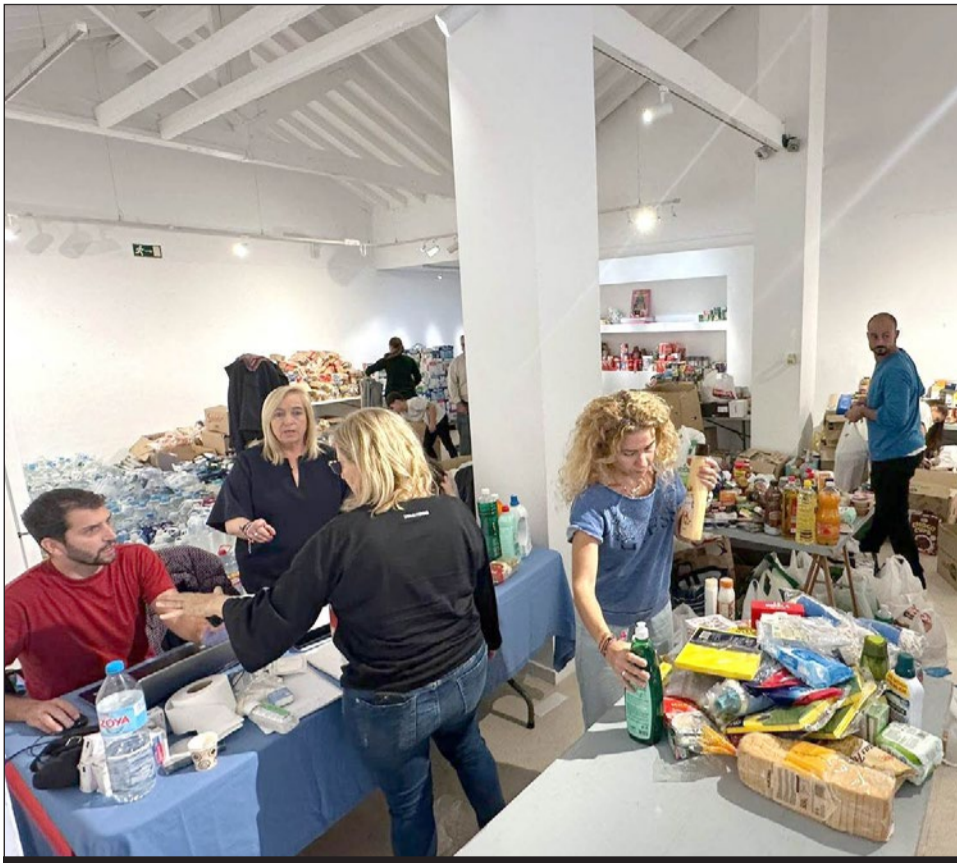
Imagen del Museo de la Ciudad repleto de donaciones.