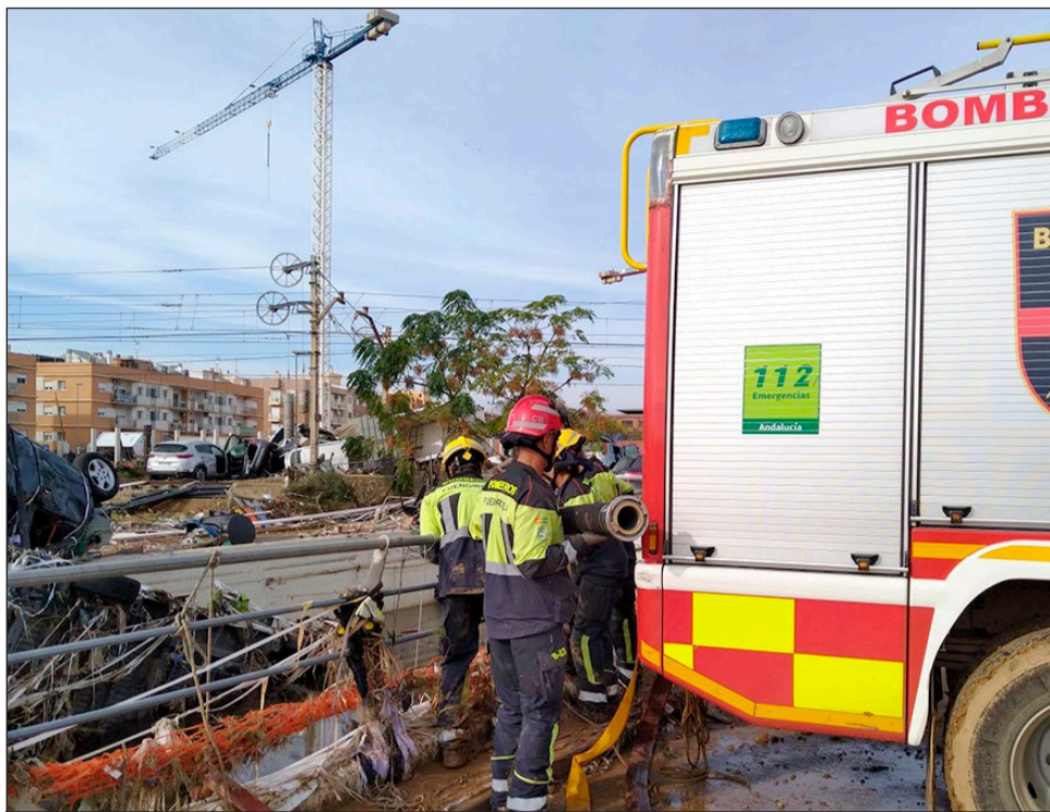
Bomberos de Fuengirola desaguando en un paso subterráneo en la localidad de Alfajar.