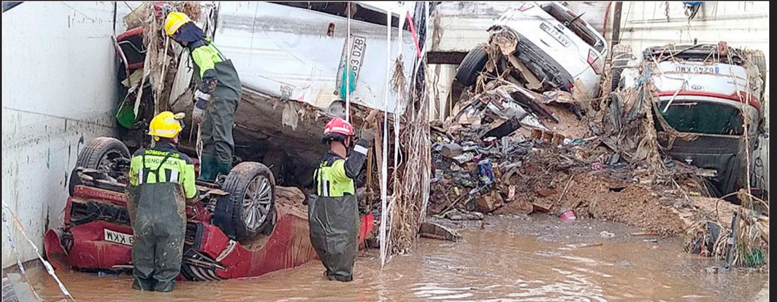
Bomberos de Fuengirola trabajan en un paso subterráneo en la localidad de Alfafar, una de las más afectadas por el temporal. Abajo, uno de los tráilers que han partido hacia Valencia.