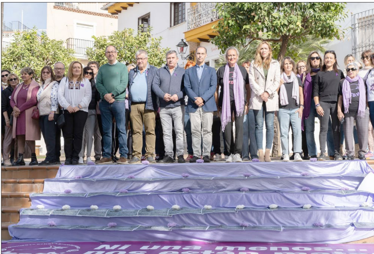
El acto comenzó con cinco minutos de silencio y la lectura de un manifiesto a las puertas de la Casa de la Cultura.