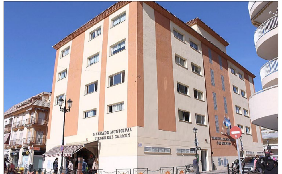
Para cualquier duda sobre la tramitación los interesados pueden dirigirse a la Tenencia de Alcaldía de Los Boliches.

dos tienen que estar inscritos como demandantes en el Servicio Andaluz de Empleo (SAE), y además, alistarse en alguno de los seis códigos de cada uno de los grupos de trabajo anteriormente citados. Éste, junto con ser mayor de 45 años, son los requisitos para poder optar a alguna de las ofertas planteadas en este programa.