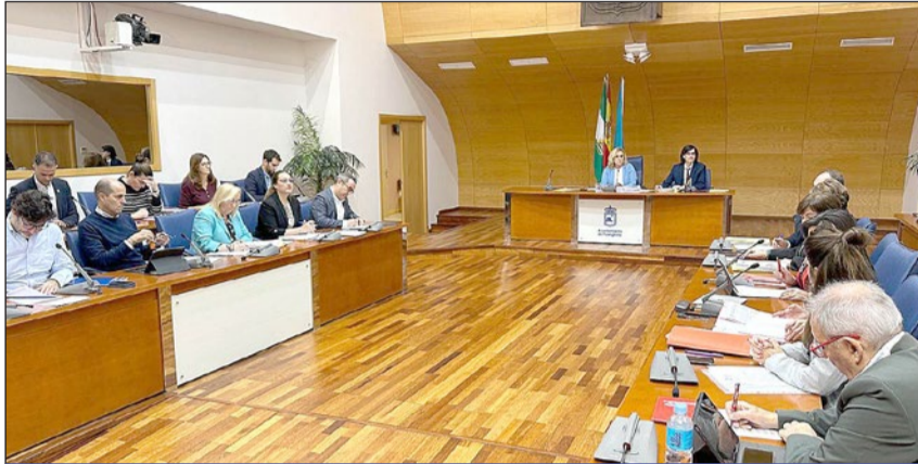
Momento de la sesión plenaria correspondiente al mes de octubre celebrada ayer.

Igualmente, a la vista de las diferentes actuaciones destacadas lleva-