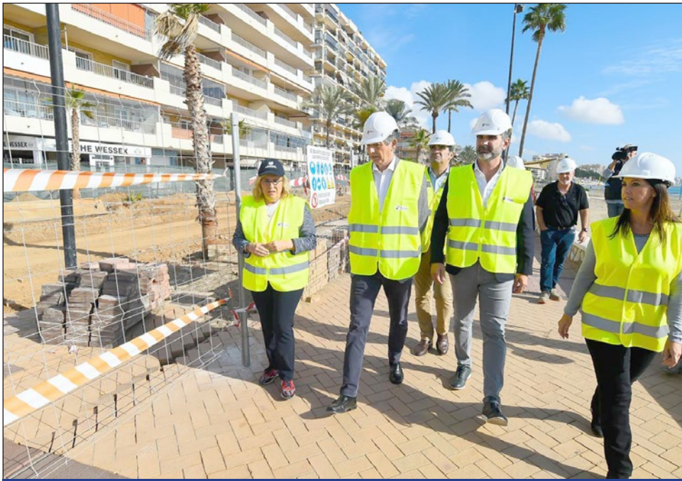
La alcaldesa y el consejero andaluz, ayer, durante la visita a los trabajos.