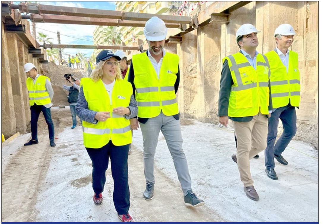
La alcaldesa y el consejero andaluz durante la visita a las obras del colector de saneamiento integral.