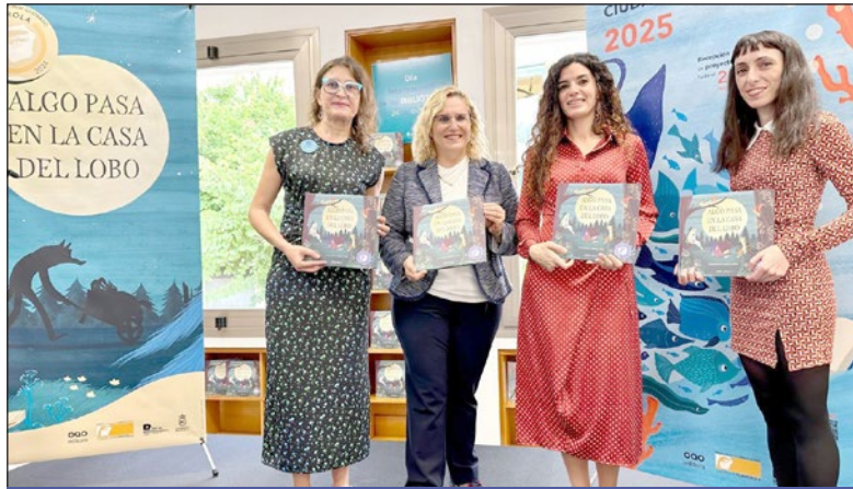
La alcaldesa y la directora de las bibliotecas posan con las ganadoras de esta edición.

En este sentido, la regidora señaló que "de nuevo, entre todos, y con el apoyo fundamental de la editora OQO, estamos consiguiendo dar a conocer a Fuengirola como un referente cultural a nivel internacional. Por lo tanto, vamos a seguir apostando por los álbumes ilustrados con este premio. Por la cultura y por ofrecer al bonito mundo