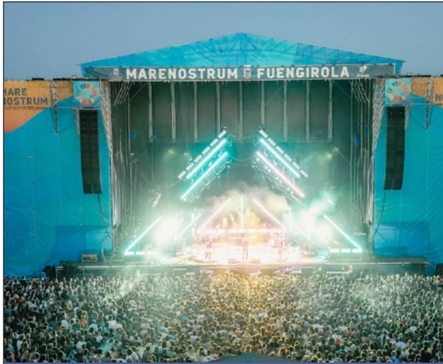
Imagen del concierto de Queens of the Stone de este año en Marenostrom.