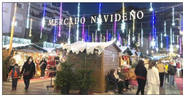
Imagen de una edición anterior del mercado navideño.