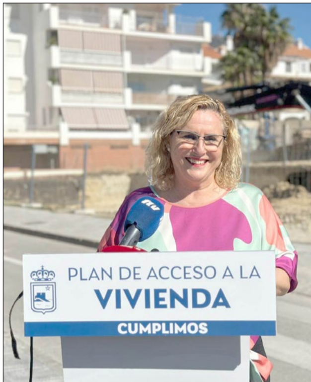
La alcaldesa informó del Plan de Acceso a la Vivienda.

La inversión total en esta iniciativa municipal asciende a 6,5 millones de euros,