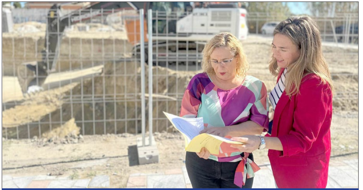
La alcaldesa y la concejala de Vivienda consultan el plano de las Viviendas de Apoyo Municipal.

ESTA INICIATIVA SE CELEBRARÁ DEL 29 DE NOVIEMBRE AL 22 DE DICIEMBRE