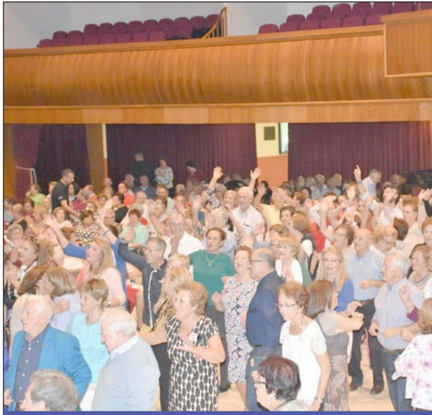
Imagen de una edición anterior de la Fiesta de Otoño.