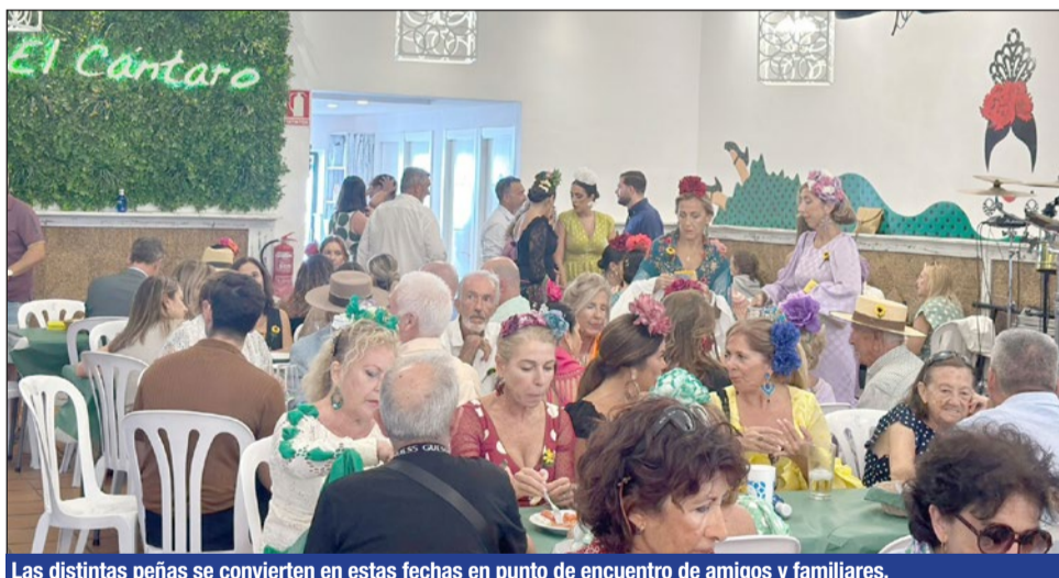
Las distintas peñas se convierten en estas fechas en punto de encuentro de amigos y familiares.