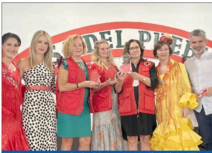
El PSOE ha reconocido este año a Cruz Roja durante la celebración del Día de la Militancia.