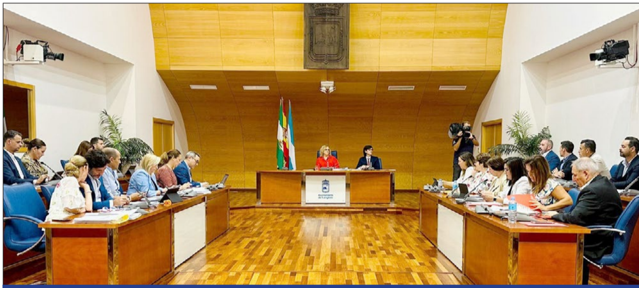
Momento de la sesión plenaria correspondiente al mes de septiembre celebrada ayer.